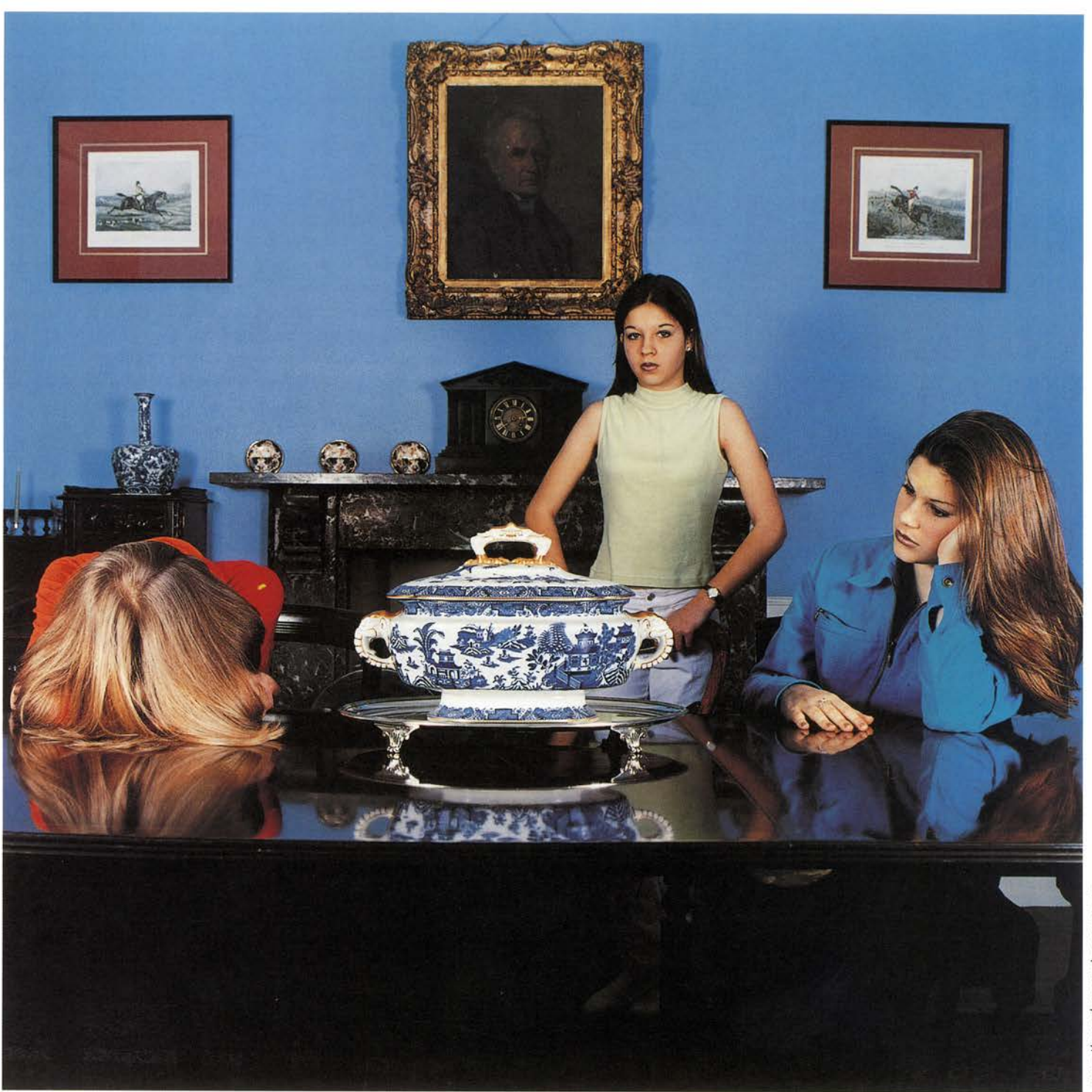
El comedor [Francis place], 1997.

Museo Nacional Centro de Arte Reina Sofía