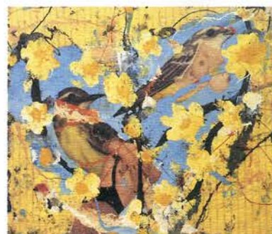
Los pájaros anómalo, love birds , 1998, 250 x 250 cm, óleo sobre güatiné.

Museo Nacional Centro de Arte Reina Sofía