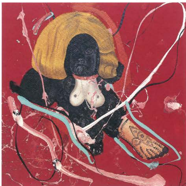
La princesa negra, la vie des bêtes , 1998, 250 x 250 cm, pintura acrílica sobre guata.

Todo el trabajo de este autor parte de la reflexión sobre el exceso iconográfico que invade al hombre contemporáneo. Sus grandes telas (arpilleras, lonas, toallas, mantas, grandes retales, etc...) han sido el soporte dispar de unas creaciones abstractas, donde la figuración sólo estaba presente ocasionalmente en los estampados industriales de este material base. Desde sus primeras exposiciones, a finales de los ochenta, los grandes cuadros se han mostrado normalmente acompañados de collages de imágenes fotográficas impresas. Este trabajo de compás agilizaba la lectura de unas obras donde la descomposición de las partes, la falta de núcleo, la libertad de ejecución y el caos de la contemplación se conjugaban.