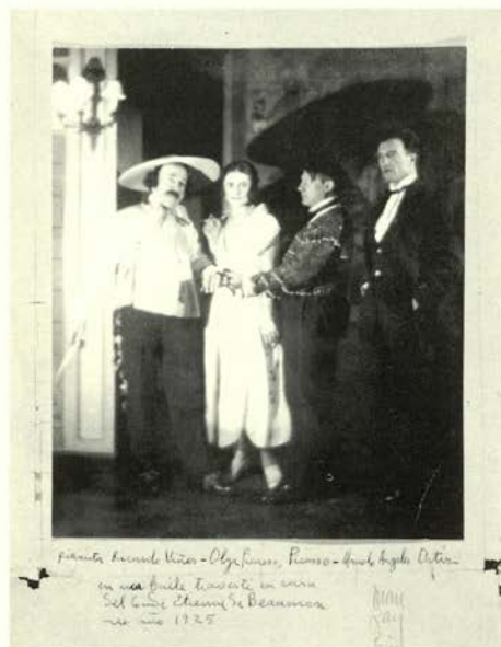
Ricardo Viñas, Olga Picasso, Pablo Picasso y Manuel Angeles Ortiz en el baile del Conde de Beaumont, 1925

1922 y la solarización en 1929. Emplea muchos efectos como la superimpresión, la deformación intencionada y la inversión de valores. Inventa, construye, compone e imagina una fotografía no clásica, la llamada fotografía surrealista. La improvisación es un instrumento de su trabajo.