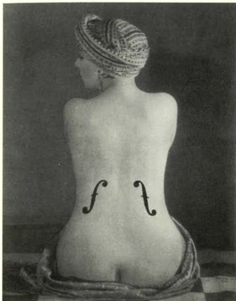
Le violon d'Ingres. 1924 Musée National d'Art Moderne Centre Georges Pompidou, Paris.