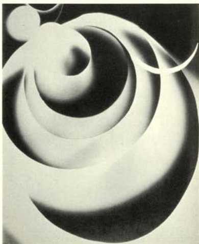
Champs délicieux , 1922 Musée National d'Art Moderne Centre Georges Pompidou, Paris.

Entre los personajes retratados están Kiki de Montparnasse (Alice Prin), la fotógrafa, Lee Miller y la artista, Meret Oppenheim. Los retratos de escritores y artistas, entre ellos, Picasso, Miró y Dalí, se publicaron en Vanity Fair , Vogue , Vu y Harper's Bazaar y los trabajos más experimentales, de "producción creativa" en sus propias palabras, en la revista surrealista, Minotaure .