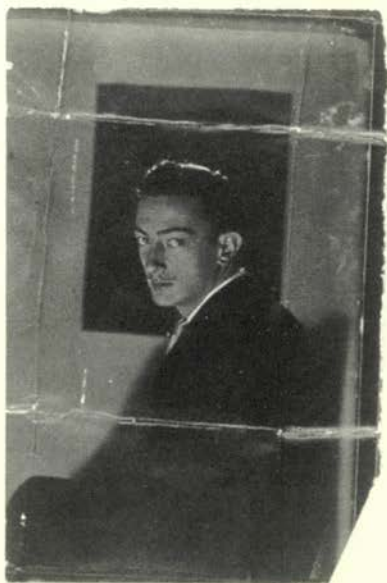
Salvador Dalí, 1921 Musée National d'Art Moderne Centre Georges Pompidou, Paris.

la reproducción del espacio no euclidiano. Casi todas las fotografías proceden de la donación Juliet Man Ray al Centre Georges Pompidou y de la donación realizada por Lucien Treillard en el citado museo.