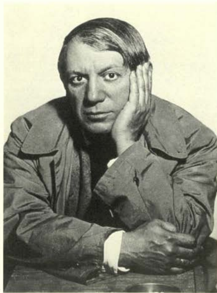
Pablo Picasso. 1933 Musée National d'Art Moderne Centre Georges Pompidou, París.

Pronto experimenta con las posibilidades plásticas de la fotografía, inventando la rayografía (la fotografía sin cámara) en