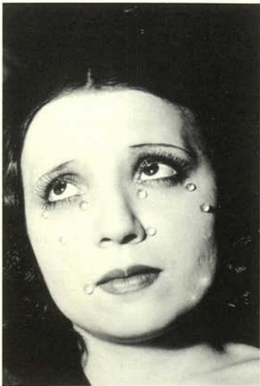
Lydia, étude pour Les Larmes. 1932 Musée National d'Art Moderne Centre Georges Pompidou, Paris.

Entre los personajes retratados están Kiki de Montparnasse (Alice Prin), la fotógrafa, Lee Miller y la artista, Meret Oppenheim. Los retratos de escritores y artistas, entre ellos, Picasso, Miró y Dalí, se publicaron en Vanity Fair , Vogue , Vu y Harper's Bazaar y los trabajos más experimentales, de "producción creativa" en sus propias palabras, en la revista surrealista, Minotaure .