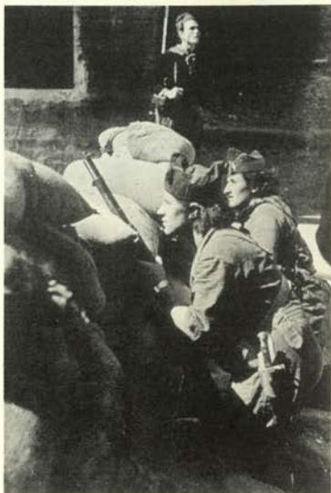
Milicianas (Barcelona, agosto 1936).

Con sus amigos Henri Cartier-Bresson, David Seymour ("Chim"), George Rodger y William Vandivert, funda la agencia fotográfica y cooperativa Magnum en 1947, cuyo objetivo era que el fotógrafo pudiera controlar sus imágenes. Tras su muerte, en 1974, su hermano, Cornell Capa, llevado por la determinación de mantener vigente la obra de Robert Capa y de otros periodistas gráficos, funda el Centro Internacional de Fotografía de Nueva York.