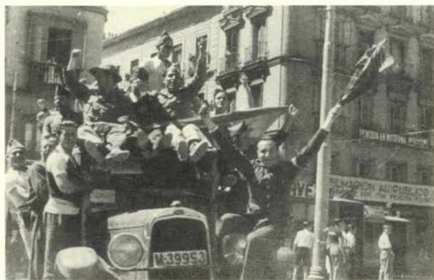
Madrid (agosto/septiembre 1936).