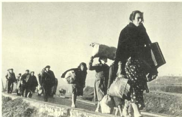
Refugiados en la carretera de Barcelona a Francia (25-27 enero 1939).

en la Segunda Guerra Mundial. Particularmente famosas son las tomas realizadas en Francia, durante el desembarco en la Playa de Omaha, en Normandía. Entre 1948 y 1959 emprendió tres viajes a Israel para fotografiar la declaración de independencia de Israel y la lucha subsiguiente. Murió en Vietnam, en 1954, al pisar una mina, cuando trabajaba como reportero para la re-