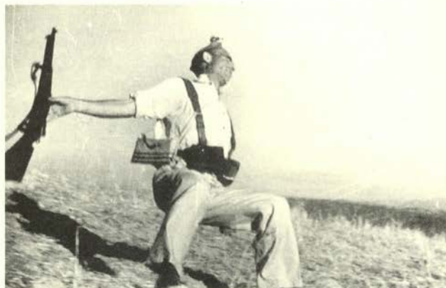
Muerte de miliciano (Cerro Muriano, 5 septiembre 1936).

Capa continuó como fotoperiodista de guerra, captando la invasión de China por los japoneses (1938), y, posteriormente, diversos frentes del lado aliado