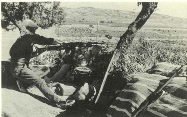
Frente de Aragón (agosto 1936)

La selección se ha realizado tomando en cuenta el gran interés humanitario siempre mostrado por Robert Capa. La mayoría son fotografías realizadas en primer plano: de ahí el título de la exposición, Capa: Cara a Cara .