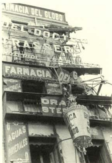
Farmacia del Globo, Plaza Antón Martín (Madrid, enero 1937).