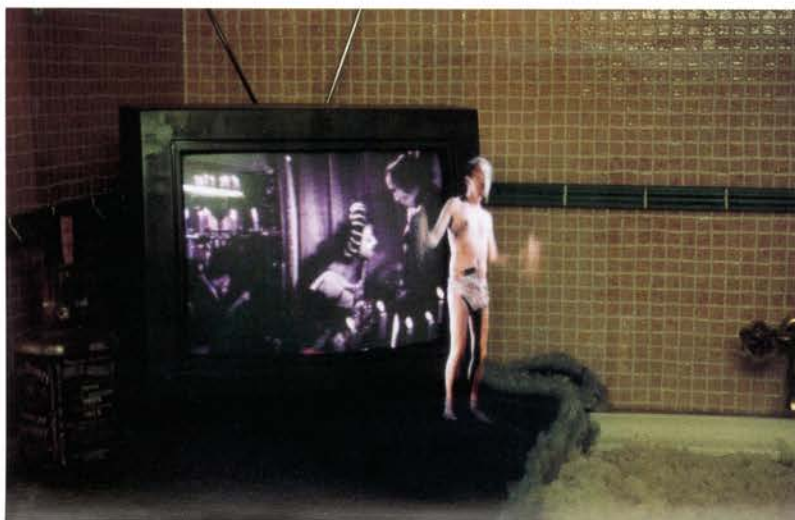
Un spectacle de qualité (detalle) 1996. Colección de la FRAC des Pays de Loire, Nantes.

Museo Nacional Centro de Arte Reina Sofía