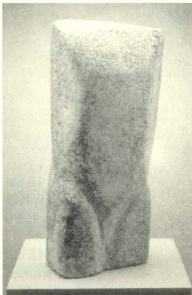
Torso, 1948 Yeso (66 x 31 x 20 cm.) Colección privada

Además, Chillida tiene obras públicas por todo el mundo, interviniendo