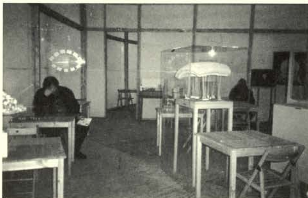
Proyecto 28 Información a través de la Noosfera

Cada estancia está dedicada a un personaje más o menos imaginario desarrollado por Kabakov, cada proyecto está representado mediante una maqueta junto a la que se encuentra una mesita y una silla; sobre la mesa hay una descripción y un comentario sobre cada idea. Después de tomar asiento junto a la mesa, el visitante puede familiarizarse sin prisas con la esencia del proyecto, de este modo, al pasar de un proyecto a otro, de una mesa a otra, el espectador, guiado por el autor, sentado en el ambiente especialmente iluminado,