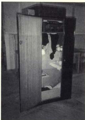
Proyecto 11 Concentración en el armario