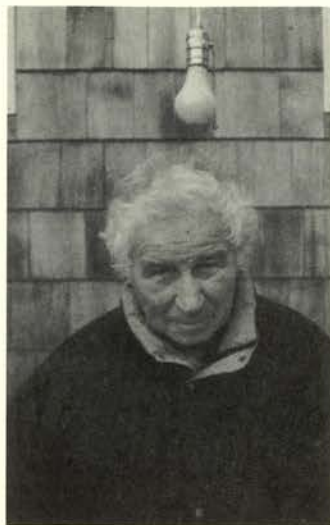
Ilya Kabakov Long Island, 1998

Esta instalación, -uno de los más ambiciosos proyectos del artista, producto de tres años de trabajo (1995-98)- se articula alrededor de una estructura ligera de madera cuyo interior está organizado en sucesivas estancias, que van trazando una espiral que asciende hasta una segunda planta. El espectador camina por la exposición pasando de una habitación a otra. Los proyectos, un total de 65, se agrupan dentro de tres grandes temas: proyectos relacionados con mejorar la vida de otras personas; proyectos que estimulan la creatividad y proyectos encaminados a perfeccionarse uno mismo como individuo.