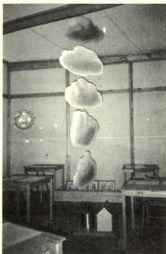
Proyecto 51 Organización de las nubes