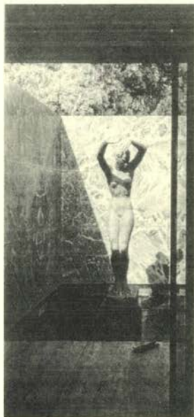
Pabellón de Barcelona, 1988-98 Fotografía en color, 270 x 120 cm (Serie de 12 fotografías)

El MNCARS presenta en sus salas del Palacio de Velázquez la primera exposición monográfica del artista alemán Günther Förg en España. Siguiendo la línea de las exposiciones que han tenido lugar en el Palacio de Velázquez durante los últimos años, el fuerte carácter del edificio se convierte en punto de partida para un proyecto específico. Günther Förg analiza el lugar con precisión para desvelar una vez más sus cualidades espaciales y potenciarlas, proyectando un montaje en el que la obra y su instalación adquieren un significado indisoluble. En Förg advertimos referencias procedentes de artistas aparentemente tan dispares como Barnett Newman, Blinky Palermo o Jean-Luc Godard. A partir de 1980, Förg utiliza en su trabajo una inusual variedad de técnicas y soportes, produciendo frecuente, simultánea y equivalentemente ensamblajes, obra fotográfica, pintura mural, acuarelas, dibujos, grabados, estructuras en bronce y pintura, a través de las que el artista profundiza en su investigación sobre la relación entre forma, color y superficie.