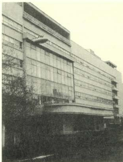
Edificio Pravda, 1995-98 Fotografía en color, 240 x 160 cm

En sus fotografías aparecen edificios emblemáticos de la arquitectura de la Bauhaus, de la revolución soviética en Moscú o de la arquitectura racionalista italiana y alemana, confrontados con figuras y retratos femeninos e incluso con referencias al paisaje. Aunque Förg está interesado en una arquitectura con contenido político, no es su intención hacer un juicio histórico, sino rendir homenaje a la racionalidad y claridad de la estructura constructiva.