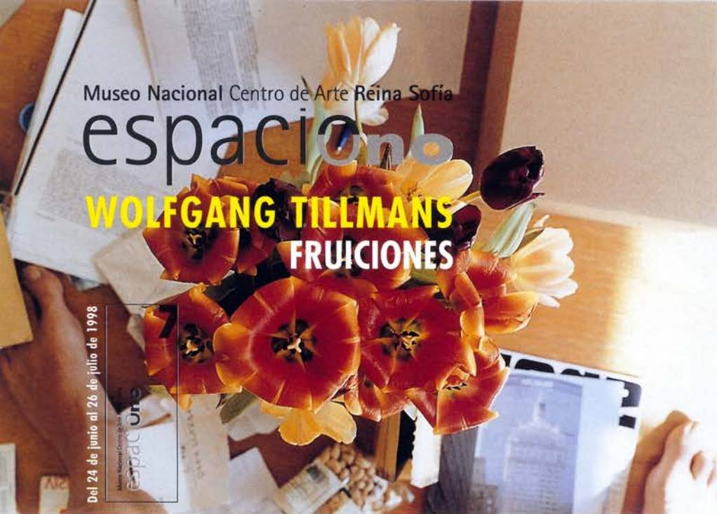
Nsoya tulips, 1997

Museo Nacional Centro de Arte espacio uno