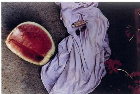
Stilleben Nüßchen 1, 1997