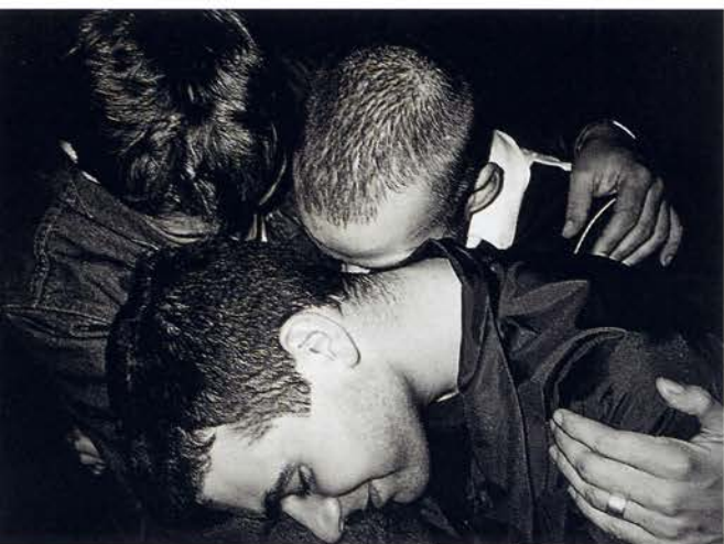
Arkadia 1, 1996