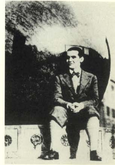
Federico García Lorca sentado junto a la bola de pórtido a la entrada de la biblioteca de la Universidad de Columbia. Nueva York, 1929.

En su casa de La Huerta de San Vicente Federico escribe. Allí le van llegando cartas y recuerdos de los amigos más próximos, más queridos de esos años. Recuerda a sus ídolos literarios -Garnier, Walt Whitman, Hart Crane, T.S. Elliot...-, a sus iconos mentales, aquellos que comparte con la vanguardia, los de la modernidad fracturada que a veces se convierte en muchas, que se disfraza para que nadie la reconozca, co-