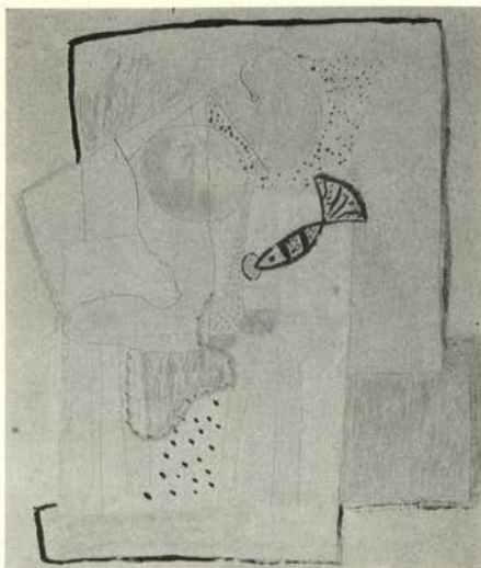
Naturaleza Muerta , 1927.