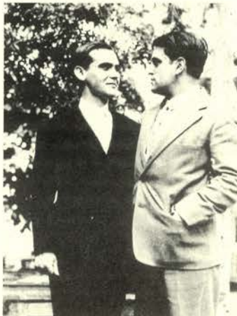
Federico García Lorca (izquierda) y Luis Buñuel (derecha), en la Residencia de Estudiantes. Madrid, 1922.