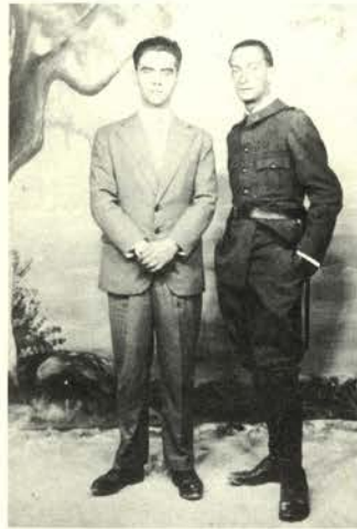
Federico García Lorca (izquierda) y Salvador Dalí (derecha). Figueras, 1927.

Federico empieza por esos años a reafirmar algo que desde siempre había intuido: las artes, cada una de ellas, forman un todo unitario. Si incluye hábilmente en su poética los elementos populares de lo "español" tradicional -animado por su amistad con La Argentinita y el torero Ignacio Sánchez Mejías que le muestran una forma diferente de enfrentar la "jondura"-, consigue también aglutinar alrededor de su portentosa personalidad y en las páginas de sus textos música, pintura, cine, poesía... Logra rodearse de los más significativos amigos, Benjamín Palencia, Rafael Barradas, Gregorio Prieto, Ernesto Halffter, Gustavo Durán, José Moreno Villa, Manuel Altolaguirre, Adriano del Valle, Rafael Alberti, Gerardo Diego, José Bergamín, por citar sólo a algunos entre tantos.