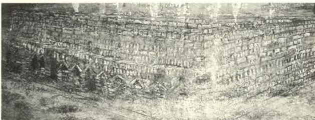
Das Geviert, Bloque 1997 Emulsión, acrílico, shellac, arcilla quemada, arena sobre lienzo (280 x 750 cm.) Colección Robert and Susan Sosnick, Bloomfield Hills, Michigan

Podemos considerar el trabajo de Kiefer como un intento de sintetizar las grandes tradiciones artísticas del pasado más próximo y más lejano, y también un intento por superarlas. El artista ha utilizado las convenciones de la Pintura de Historia, su ambición retórica, su interés por la perspectiva y sus técnicas teatrales, ofreciéndonos como resultado una odisea a través del tiempo. Pero al contrario que los pintores históricos tradicionales, Kiefer