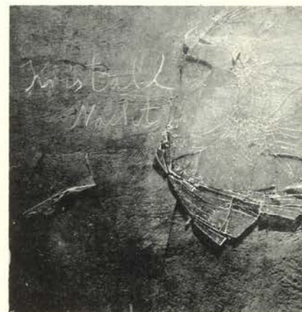
Kristall Nacht, La Noche de los Cristales 1996 Portada del libro. Fotografía, acrílico sobre cartón

Kiefer produce lienzos de una considerable complejidad pictórica debidos a la tensión visual entre el plano bidimensional y el espacio tridimensional. Estas tensiones son representativas de uno de los más significativos motivos de su arte, el intento de unir la escala y la riqueza visual del Expresionismo Abstracto con temas cargados de significado; en otras palabras, unir los polos forma y contenido, lo concreto y lo ideal, la vida y el arte. Las pinturas de Kiefer son elegías épicas a la condición humana, que laten con sentidas y profundas emociones, una sutileza temática compleja y una extraordinaria agitación en la superficie.