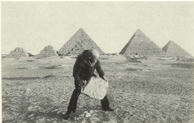
Yo construyo una pirámide (una secuencia de 6 fotos), 1978

Sin embargo, la presencia de Michals en las secuencias no significa que estas sean específicamente autorretratos. Mas bien, él está presente porque es el único protagonista disponible; casi todos los artistas hacen, en algún momento, un autorretrato con motivaciones varias. En las fotografías que Michals denomina "autorretratos" se nota una diferencia de intención. Tanto Autorretrato como si estuviera muerto