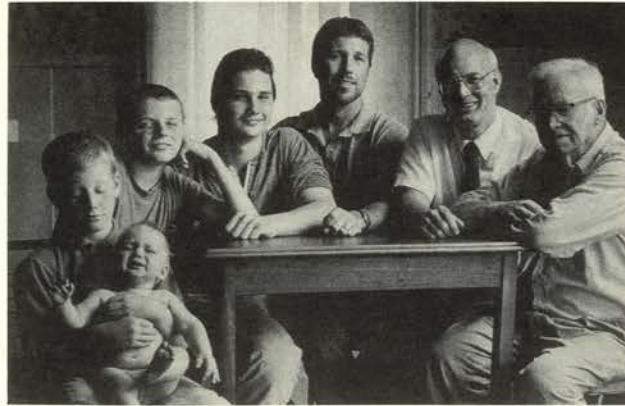
Siete edades del hombre , 1994

A mediados de los años sesenta (antes de la incorporación del vídeo al arte y en pleno auge del arte mínimo y conceptual), Michals empieza a emplear la secuencia fotográfica, con tres y hasta quince imágenes. No