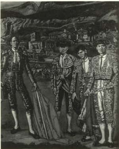
El Lechuga y su cuadrilla, ca. 1915/17-1932 Óleo/lienzo (220 x 228 cm.) Colección Banco Santander

En 1906 pinta Chulos y chulas donde refleja los tipos populares madrileños que describe en "Madrid. Escenas y costumbres, Baile de chulo en las Ven-