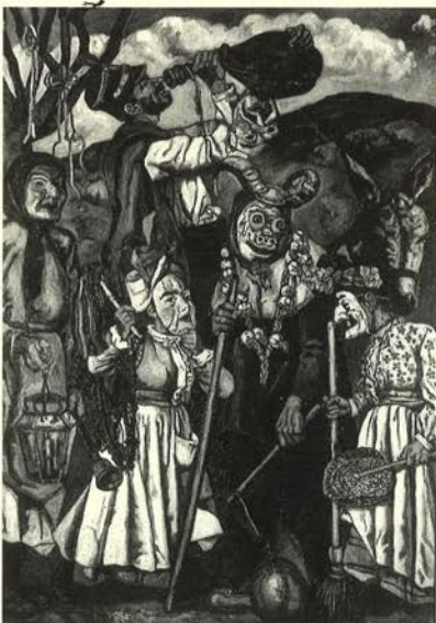
Máscaras con burro , 1932 Óleo/lienzo (204 x 149 cm.) Colección Banco Santander

connotaciones con "El triunfo de la muerte" de Peeter Brueghel el Viejo (1525/1530-1551), (Colección Museo del Prado) y como señala certeramente Sánchez Camargo "es un alarido sin eco".