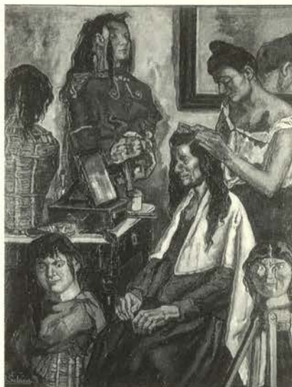
La Peinadora, 1918 Óleo/lienzo (140 x 109 cm). Colección Banco Santander

tas". Solana nunca quiso vender esta obra que conservará hasta su muerte, apareciendo en el testamento del pintor.