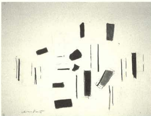
Sin título, 1977 Carboncillo y pastel/papel (54,6 x 74,9 cm.) Colección particular

Celebra su primera exposición individual en el Ateneo de Madrid en 1928 y al año siguiente viaja a París.