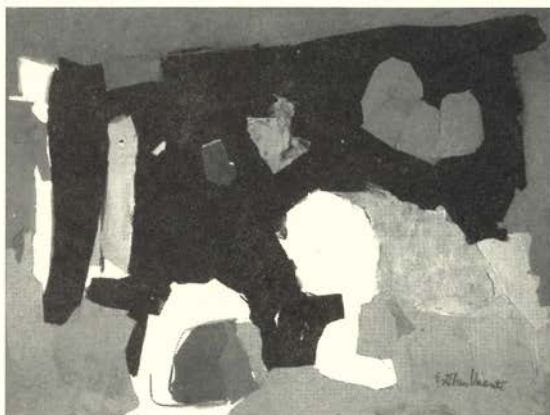
Black, Grey and Green, 1961 Papel coloreado, carboncillo y papel/cartón (78,5 x 98,5 cm.) Museo Nacional Centro de Arte Reina Sofía

Pueden verse aquí los distintos momentos de su dilatada carrera, que desvelan su preocupación por la búsqueda del equilibrio y su especial sensibilidad para integrar de forma sutil el entorno en su obra.