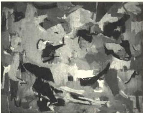
Nº 2, 1952 Óleo/lienzo (101,7 x 127,2 cm.) Riva Yares Gallery, Santa Fe, Nuevo Mexico. Scottsdale, Arizona

Ilustra entonces revistas literarias como Verso y prosa o Mediodía .