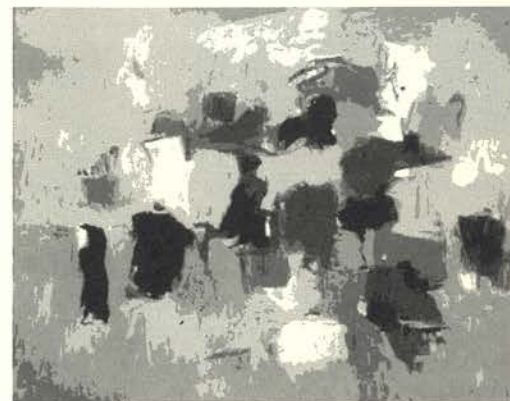
Number 3, 1958 Óleo/lienzo (122,6 x 152,4 cm.) Whitney Museum of American Art, Nueva York

Su trabajo se afianza en el lenguaje plástico del Expresionismo Abstracto, manteniendo -como todos los que de ese movimiento destacaron- su gran personalidad, de trasfondo europeo e impermeable a las críticas apasionadas y discusiones del momento.