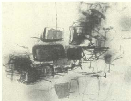
Sin título, 1960 Carboncillo y tinta/papel (42 x 55 cm.) Museo de Arte Contemporáneo Esteban Vicente, Segovia

Nuevo México en Albuquerque, en la National Academy of Design o en la Vermont Studio School.