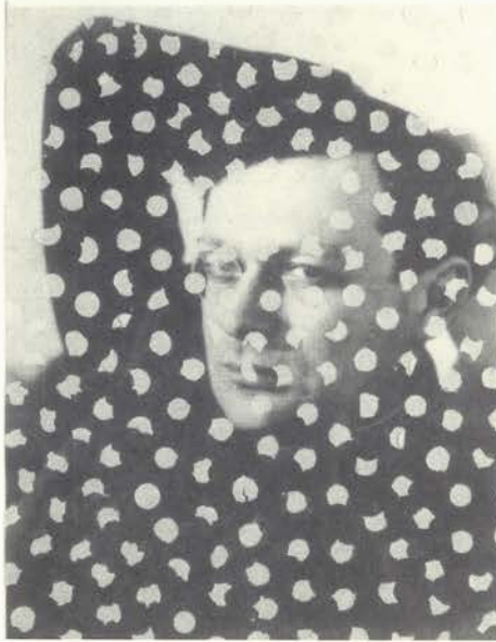
Tristan Tzara, 1991 Técnica mixta/papel 32x25 cm.

La exposición consta de unos setenta óleos, cincuenta dibujos, cuarenta esculturas y material escenográfico, que recorren el quehacer del artista desde su partida hacia el exilio en 1958, momento que coincide con el inicio de su trayectoria como pintor, hasta la actualidad. En este largo tiempo se pueden establecer dos grandes periodos, en el exilio (1958-1976) y después del exilio (1976-1998) , significativamente separados por la devolución del pasaporte español en 1976.