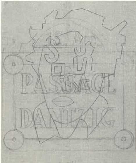
Chaim soutine, 1993 Lápiz/papel 50x44 cm.

Desde un primer momento, su trayectoria creativa se encuentra muy influida por las circunstancias políticas, culturales y artísticas vividas en España y Europa en los últimos cuarenta años. Tras terminar sus estudios de Periodismo en 1957, se instala en París con la intención de dedicarse a escribir. En esos años, el contacto con los círculos de exiliados españoles decanta su actitud de oposición al régimen franquista, al mismo tiempo que inclina su vocación hacia la pintura.