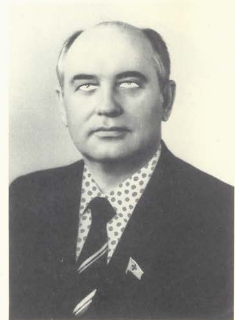
Gorbachov, 1996 Fotografía y gouache 40,5x30,5 cm.

Con la recuperación del pasaporte español en 1976, Arroyo empieza a exponer de nuevo en España, después de que en 1963 su primera exposición individual en la Galería Biosca fuera clausurada por el Ministerio de la Gobernación. La impresión del retorno provoca otra nueva serie de obras inspiradas en la figura de Ulises, a la que sucede un conjunto de obras tituladas "Toda la ciudad habla de ello". También surge la figura del deshollinador, con