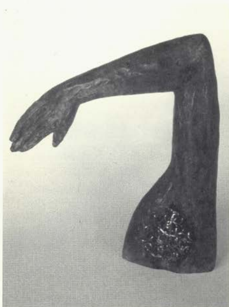
La maja desnuda, 1987

Su condición de dibujante y grabador le lleva en estos años a realizar el que quizás sea su trabajo más ambicioso en este campo, la ilustración del Ulyses de James Joyce. Así mismo, continúa con su actividad como escenógrafo, destacando el estreno de su pieza teatral Bantam .