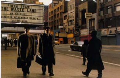
New York, 1997.

"Streetwork" es un nuevo trabajo aún no acabado que empezó a gestarse a partir de 1993. El autor decide prescindir del control absoluto que hasta la fecha había mantenido en sus imágenes. Philip-Lorca de Corcia sitúa la cámara sobre un trípode en la calle, esconde el flash