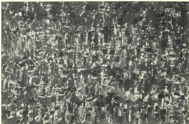
Golden City 1956 Témpera sobre papel 61 x 91,5 cm. Colección Privada, Zurich.