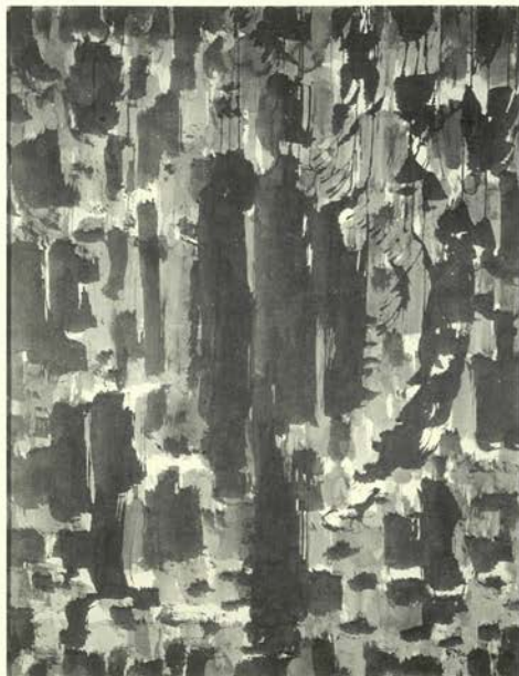
Sin Título, 1957 Tinta Sumi sobre papel 113 x 87,5 cm. Colección Miani Johnson, cortesía de la Galería Jorge Mara.

La muestra realiza un recorrido por los diferentes aspectos y etapas creativas del artista: