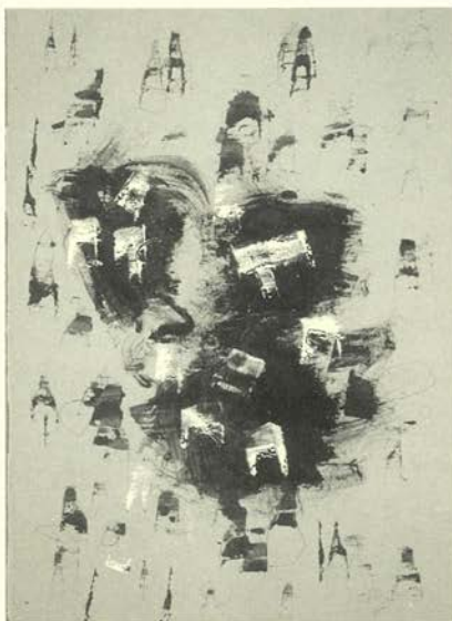
Interior Exterior, 1955 Técnica mixta sobre papel 45 x 30 cm. Portland Art Museum, donación del Sr. Thomas Coad y Sra.

No hay arte abstracto. Siempre se empieza con algo . Más adelante puedes retirar todas las huellas de realidad. En cualquier caso, ya no hay peligro: la idea del objeto habrá dejado una marca indeleble. Es lo que puso el artista en acción, lo excitó sus ideas y agitó sus emociones. Le guste o no, el hombre es un instrumento de la naturaleza. No copié la luz de los acantilados de Dieppe, ni siquiera presté una atención especial. Sencillamente, estaba empapado de ella. MARK TOBEY