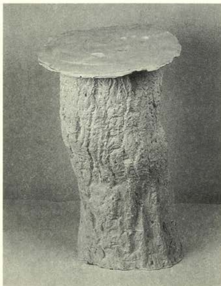
Colmenas , 1996-97 Terracota policroma.

años ochenta como uno de los representantes más significativos de la pintura española contemporánea, asociado a Barceló, Broto y Campano; realiza su primera exposición en la Galería Trans-form, París en 1982 y en Madrid, en la Galería Vijande, el año 1984. A partir de 1985-86 obtiene el reconocimiento internacional, siendo su obra objeto de numerosas exposiciones. En 1989 obtiene el Premio Nacional de Artes Plásticas del Ministerio de Cultura Español. En su evolución Sicilia refuerza su condición de pintor preguntándose por los procesos de la pintura y su percepción. En la actualidad vive y trabaja en París y Mallorca.