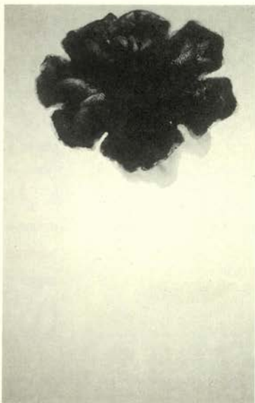
De la serie La luz que se apaga , 1996-97 Óleo, papel y cera sobre madera

Las obras aparecen agrupadas en diez series bajo el título "L'horabaixa", denominación mallorquina para ese momento del día, el crepúsculo, en el que tras el ocaso todavía persiste la claridad, Sicilia apunta a la metáfora de la oscuridad como luz, a la fugacidad del instante y a la fragilidad de la vida.