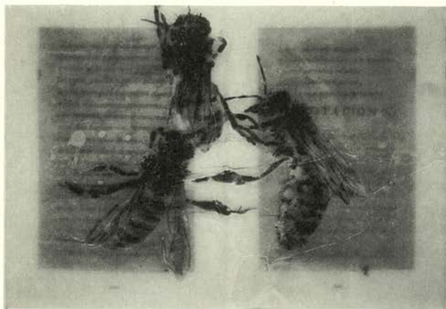
De la serie Manuscritos de Sanlúcar de Barrameda , 1992-96 Técnica mixta. Óleo, papel y cera.

La muestra presenta un recorrido expositivo que visualiza la línea poética de Sicilia como camino personal, trascendiendo su carácter lírico para adentrarse en los problemas de la visión que este artista trata de modo constante desde el principio de su carrera: la búsqueda del "corazón" del cuadro a través de un diálogo entre fondo y superficie, la luz como elemento definitorio de esa relación, y la imagen como vehículo de emoción y tensión capaz de estructurar el espacio del color.