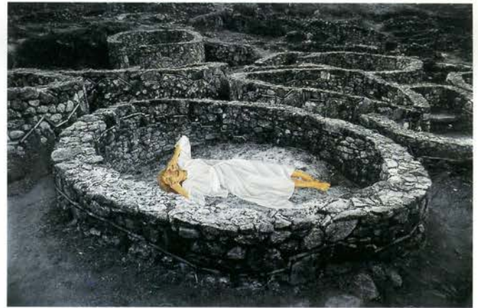
s. t., serie La locura, 1997 Óleo sobre fotografía 100 x 160 cm

El dibujo es esencial; la autora recurre al academicismo puro, aunque libre, para configurar cuerpos que rugen de obsesiones y miedos. No hay silencio en estas pinturas, no hay decoro posible; la evocación al temor y al dolor se instalan como