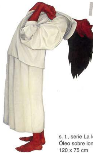
s. t., serie La locura, 1996 Óleo sobre loneta. 120 x 75 cm

Del 17 de septiembre al 20 de octubre, 1997