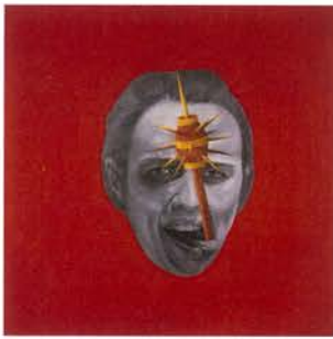
s. t., serie La locura, 1997 Óleo sobre lino 145 x 16 cm

aparece iluminada, en estado de éxtasis provocado por su peculiar situación.