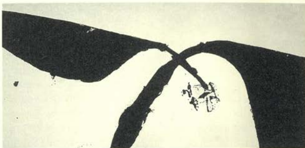
Africa No. 2