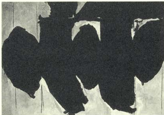
Elegy to the Spanish Republic No. 172 (With Blood)

Hasta los 25 años, Motherwell se había mantenido en una posición de observador. Sin embargo, el verano de 1941 hace un viaje a México con el surrealista chileno Roberto Matta que marca un punto de inflexión en su trayectoria. Este viaje le decanta definitivamente hacia la práctica pictórica y le pone en