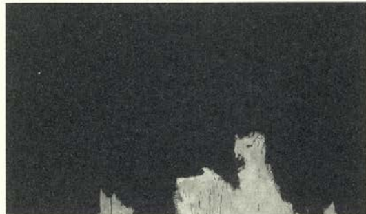
Iberia No. 2