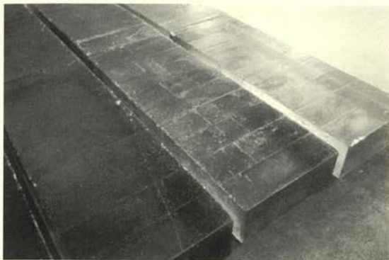
Sin título. Suelo, 1994-95