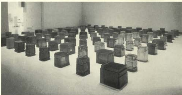
Cien espacios , 1995

Un total de 22 obras de Whiteread nos permiten confirmar una de las trayectorias más brillantes de la escultura contemporánea