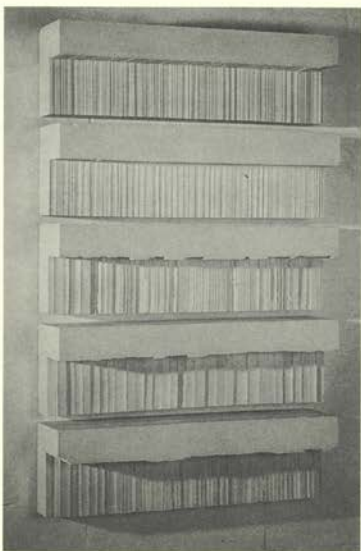
Sin título. Cinco

Contemporary Art, Chicago, 1993; Kunsthalle Basilea, 1994; Tate Gallery Liverpool, 1996. Cabe señalar su próxima participación en el proyecto "Skulptur" de Münster y en el Pabellón inglés de la Bienal de Venecia, ambos en 1997.