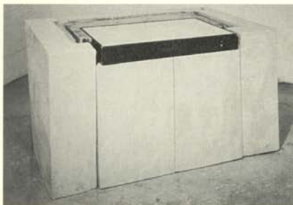
Fuerte , 1989 (Fort)

El espectador se ve enfrentado al entrar en el Palacio de Velázquez con la obra "Cien Espacios" ( One Hundred Spaces ), 1995, espacios que quedan debajo de las sillas. Obra flanqueada por "Espectro" ( Ghost ), 1990, que es el vaciado de una habitación entera y reconstruye en negativo todos los elementos de la superficie interior de la habitación: agujeros e irregularidades que desvelan la superficie visible del objeto. Estas dos obras son cruciales en la producción de Whiteread, en su relación con la domesticidad y la arquitectura. Alrededor de estos trabajos se presentan una serie de esculturas de menor escala, en las que la artista explora las relaciones entre los objetos domésticos cotidianos: mesas, colchones, suelos, lavabos, armarios... vaciadas en escayola, hormigón, resina o caucho. Whiteread hace un vaciado del espacio que ocupan los objetos, del espacio en su interior o del espacio que dejan atrás como un rastro.