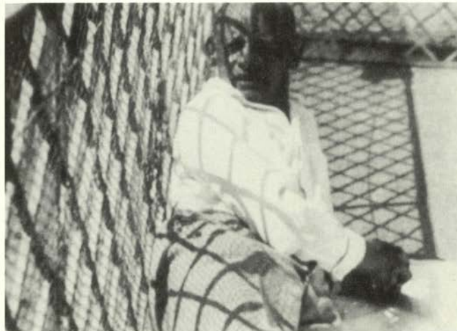
Retrato de Oskar Schlemmer

También en este periodo tendrá lugar su primera representación teatral, que llegará a ser una de las realizaciones más significativas e interesantes de su época: el Ballet Triádico , al que se dedicará con enorme ahinco y magníficos resultados una vez acabada la guerra.