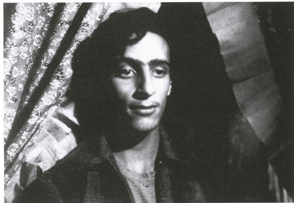
Los olvidados, 1950, Roberto Cobo

Crónica cotidiana y onírica de un grupo de "adolescentes asesinos y asesinados" (Prévert), en una "colonia" de México. A sus cincuenta años, el retorno salvaje de Buñuel. Aún sigo aquí, parece decirnos. Premio a la Dirección en Cannes. Formidable revuelo en los medios críticos.