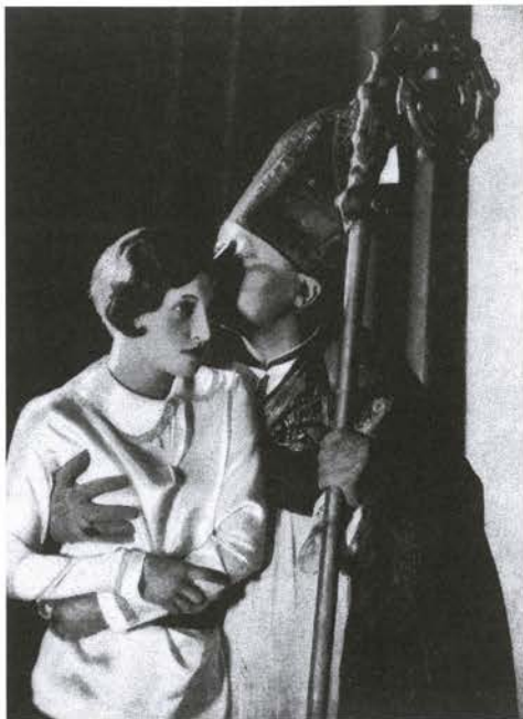
L'Âge d'or, 1930, foto de promoción

Buñuel en solitario, o casi. Un viaje clarividente por el mundo moderno, iluminado desde el cine. La primera película auténticamente insoportable (escándalo, prohibiciones, etc.), realizada por un hombre con una salud envidiable. Una hora de verdad increíble, bañada en una extraña suavidad.