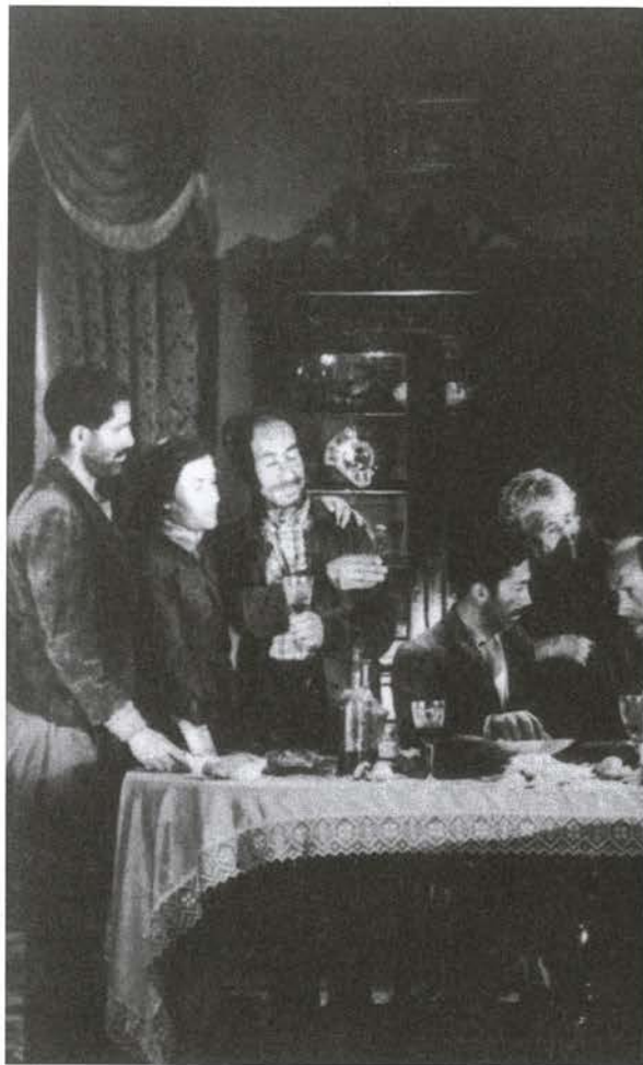
Viridiana, 1961, (la cena)

Primera película realizada en España desde "Las Hurdes", Palma de Oro en Cannes, prohibida por Franco, "Viridiana" está hecha de extrañas nupcias, gemidos persistentes y monstruos cotidianos. Un friso de imágenes fulgurantes: Buñuel es ahora un verdadero maestro. Tiene sesenta años.