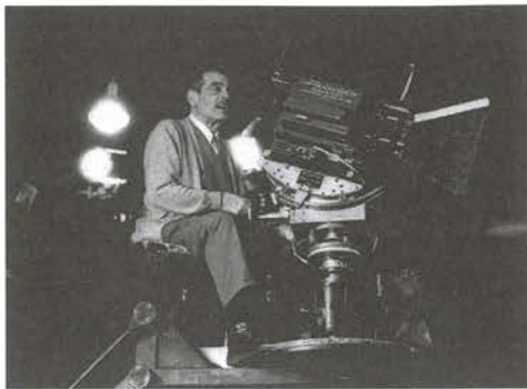
Le Fantôme de la liberté, 1974, Luis Buñuel (rodaje)