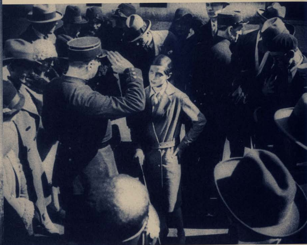
En la página anterior: Nazarin , 1958, Francisco Rabal. En esta página: Un chien andalou , 1929.