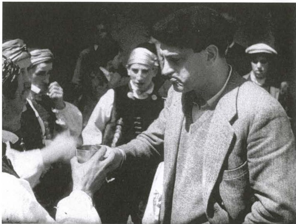
La Alberca, 1933, Luis Buñuel

Blue Velvet (Terciopelo azul, David Lynch, 1986). Int.: Kyle MacLachlan, Isabella Rossellini, Dennis Hopper. U.S.A. V.O. sub. esp.* 120'.