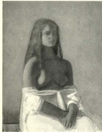
Jeune fille à la chemise blanche, 1955