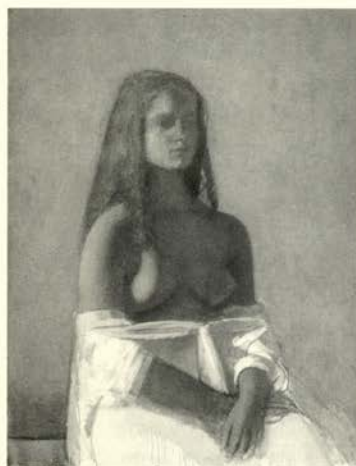
Jeune fille à la chemise blanche, 1955