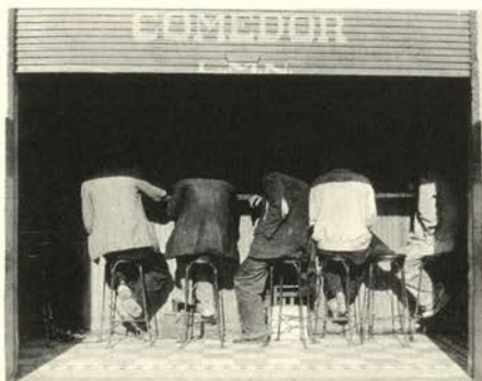
Los agachados, 1932-34