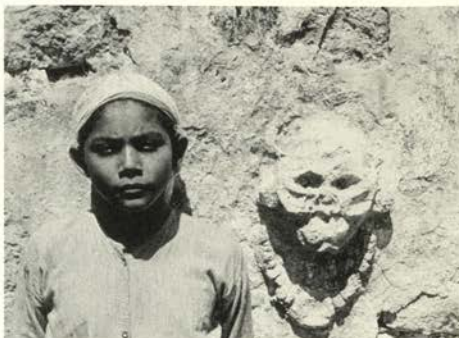
Niña maya de Tulum, 1942