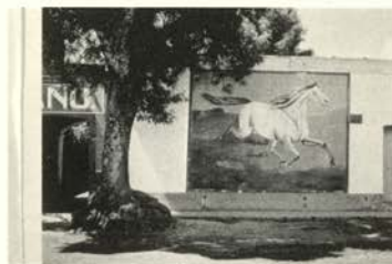
Paisaje y galope, 1932

En 1938 André Breton visita México y conoce la creación de Álvarez Bravo. Sus fotografías le fascinan y al año siguiente monta la legendaria exposición de la Galería Renou et Colle en