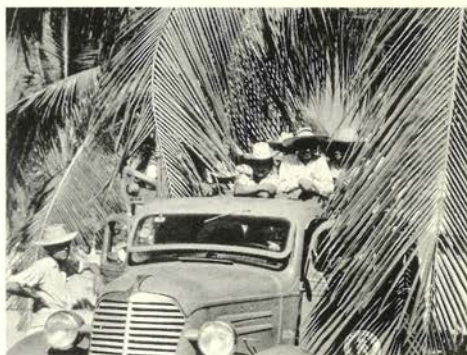
Trabajadores del trópico,