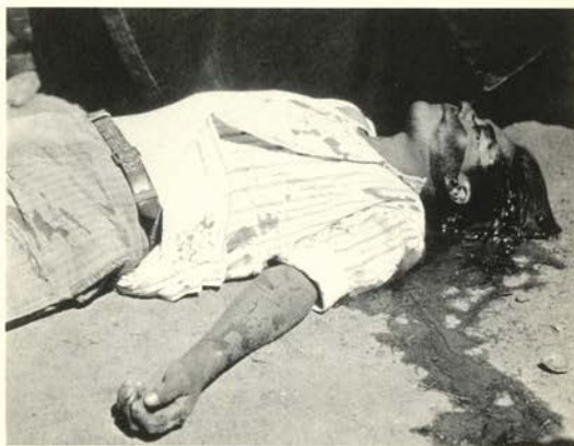
Obrero en huelga, asesinado, 1934

de palabras. Los títulos de sus obras son susceptibles de varias lecturas y no siempre tienen una relación directa con la imagen. Los agachados (1964), por ejemplo, no aluden al sufrimiento y miseria de México sino a una actitud vital: se trata de un pueblo agachado pero no vencido. Esta postura engañosamente humilde no es más que el mecanismo de defensa de una gente que quiere preservar la realidad de su espíritu inabrido y orgulloso.