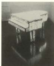
Música de cámara nº 182

Los "cartones" son tarjetas que enviaban por correo utilizando este medio como soporte y elemento de comunicación directa con el público. A través de ellas presentaban a los receptores una diversidad de propuestas. Desde invitaciones, textos, poemas, crucigramas, calendarios, felicitaciones... hasta un concierto para ejecutar en casa. Este trabajo constituye una de las aportaciones más interesantes al arte postal.