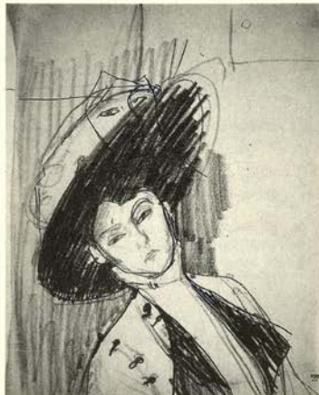
La amazona, cabeza y busto inclinados....1909 Lápiz grueso 30,8 x 23,2 cm.

Alexandre fue, durante varios años, virtualmente el único patrocinador de Modigliani: "Desde el primer día en que nos vimos me llamaron la atención sus prodigiosas dotes artísticas y le pedí que no destruyera ni uno solo de sus cuadernos o estudios y que ponía a su disposición todos mis escasos recursos. Así resulta que ahora poseo casi todas las pinturas y casi todos los dibujos pertenecientes a este período. A partir de los esbozos y de los dibujos acabados podemos seguir, paso a paso, su desarrollo durante esos años decisivos".