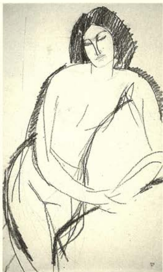
Mujer desnuda apoyándose en el antebrazo izquierdo Mina de plomo y lápiz graso 43 x 26,7 cm.

Ya desde el principio de su carrera los estudios de desnudo de Modigliani tratan casi exclusivamente de la figura femenina; anticipan las pinturas del mismo tema hechas desde 1914 hasta su muerte.