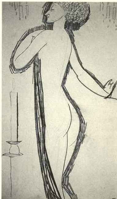
Mujer desnuda de perfil delante de ella... Lápiz graso 42,9 x 26,4 cm.

Estos estudios muestran la variedad de aproximaciones que Modigliani usó para reinventar la belleza de la forma femenina. Estilísticamente diversos, todos los dibujos aquí expuestos son de desnudos femeninos. En su variedad de poses anticipan las pinturas de dibujos recostados que harían famoso a Modigliani años después de su muerte.