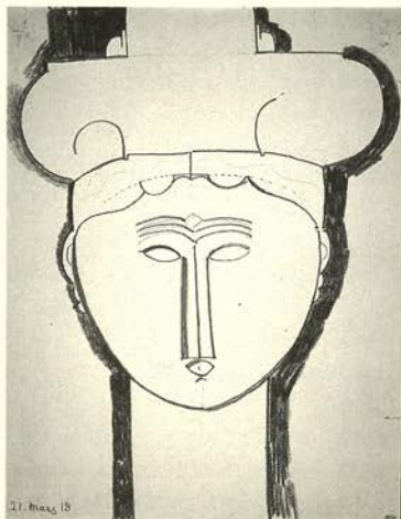
Cabeza de frente coronada de arquitectura, 1913 Lápiz azul 33,8 x 26,5 cm.

Los dibujos de cabezas escultóricas se hicieron casi al mismo tiempo que las cariátides. Modigliani trabajó en ellos como un poseso. Interpretando el arte africano, el griego antiguo y el camboyanano a través de su