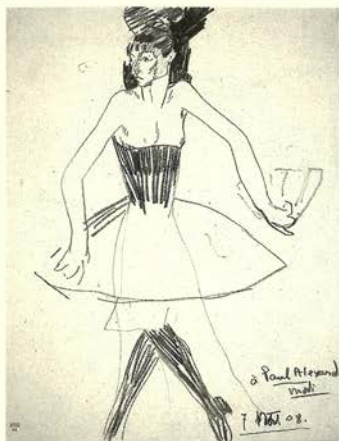
Colombina en tutú con un abanico, 1908 Lápiz graso 31 x 24,3 cm.

(1906-7) es anterior a la amistad de Modigliani y Alexandre. Sus 48 páginas recogen su abanico de intereses, especialmente el circo y sus estudios de desnudos del natural.