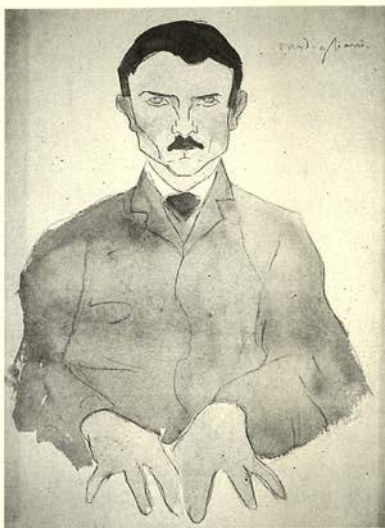
La mesa giratoria ó Retrato de medium Lápiz graso y acuarela 49 x 37,5 cm.

La rapidez y precisión con que trabajaba Modigliani, su frío distanciamiento, la audacia de sus composiciones y la imaginativa variedad de estudios que podía derivar de una misma pose hacen que estos dibujos sean excepcionalmente interesantes.