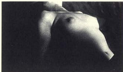
Desnudo, ca. 1931 - 1932