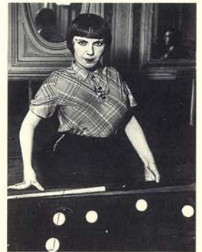
Prostituta del billar ruso, París, ca. 1932