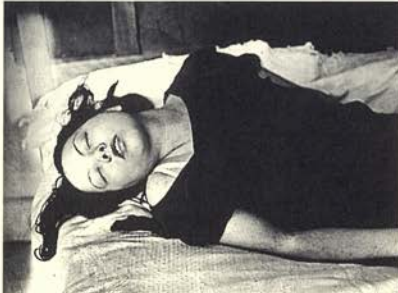
Fenómeno del éxtasis, retrato de mujer, 1932. 26,5 x 35,6 cm.

La exposición consta de 150 fotografías y se estructura en tres secciones muy diferenciadas. La primera se compone básicamente de las fotografías que Brassai hizo para la revista Minotaure ; la segunda, de las que realizó durante sus vagabundeos nocturnos en el París de los años treinta; y la tercera está dedicada a las fotografías de los graffiti que cubrían los muros de París y a la serie de cliché-verre titulada Transmutations . Por último, dos secciones más reducidas sobre la ciudad de día y los estudios de artistas y escritores complementan la muestra.