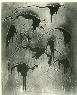
Pintura al fuego-color sin título, 1962. Pigmento seco en resina sintética/cartón carbonizado y madera. 92 x 73 cm. Colección Marianne y Pierre Nahon, Galería Beaubourg, Paris y Vence.

dad en Klein fue quizás El Vacío - una exposición oficialmente titulada "La Especialización de la Sensibilidad en el estado material primario de la sensibilidad pictórica estabilizada" (Galería Iris Clert, 1958) -. Para esta instalación / acontecimiento, los visitantes pasaban a través de varias fachadas I.K.B., bebían cócteles azules y luego entraban en el blanqueado espacio de una galería perfectamente vacía. El Vacío era una obra de arte que no estaba basada en elementos visuales, narrativos o descriptivos, antes bien al contrario, ofrecía una experiencia de primera mano de la potencia del vacío y de la expansiva y rica plenitud del espacio mismo. Dos años más tarde, cuando Klein anunció su Teatro del vacío en el semanario Dimanche, ilustrado por una fotografía de Salto al vacío en primera página, propuso otras tantas manifestaciones del vacío y diversas maneras de inducir a ello la sensibilidad humana.