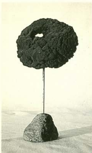
Escultura de esponja azul sin título. Pigmento seco en resina sintética/esponja y varilla metálica con base de piedra. 30 cm. de altura. Colección particular.