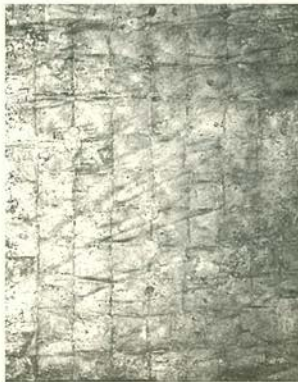
Monodoro sin título, 1961 Pan de oro/lienzo. 75 x 60 cm. Kunstsammlung Nordrhein-Westfalen, Düsseldorf.

Antes de decidir convertirse en artista, Klein alcanzó cierta categoría en judo. Para él, el judo era una actividad en la cual el cuerpo descubría un "espacio espiritual" a través de una elevada experiencia en el terreno de lo físico y lo sensorial. Lo que Klein pretendía conseguir en su arte venía a ser un fenómeno bastante similar, en particular en lo que se refiere a la creación de obras de coloración monocromática, reduccionistas pero evocativas. Lo monocromático era un modo de eliminar los elementos expresionistas, representativos, compositivos y personales, y de despertar una receptividad individual hacia las sensaciones más elementales y fundamentales en el entorno cotidiano. Con el monocromo, se apuntaba a las extensiones abiertas del espacio ... el espectáculo del color como espacio. Lo monocromático significaba también lo indefinible y lo inmaterial, conceptos de primordial importancia para Klein. "...Sentir el alma sin explicarla, sin vocabularios, y representar esa sensación...esta creo yo, es una de las razones que me han llevado a la monocromía."