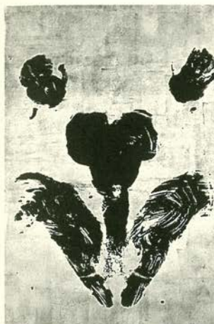
Antropometría sin título, 1960 Pigmento seco en resina sintética / papel y lienzo 107 x 72 cm. Colección José Mugarib.

el artista que utilizó sin cesar el color azul ultramarino (al que llamó "I.K.B." - International Klein Blue) I.K.B. era un resonante, luminoso tono, de gran potencial poético. Klein intensificó el color utilizando una fórmula especial que no requería un fijador al óleo. De tal forma que las partículas individuales del puro pigmento en polvo se mantienen libres, dando una apariencia particular acorde a la noción de materia en la era atómica.