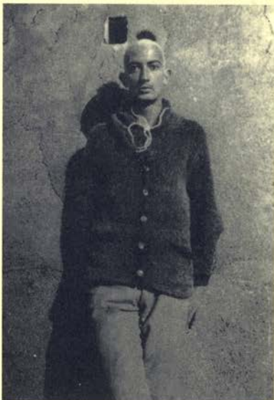
Salvador Dalí en Cadaqués, 1929

reno Villa; sus amigos, Maruja Mallo, Rafael Barradas, todo el grupo de vanguardistas madrileños de los que nacería una definición madrileña del surrealismo -cuyas fórmulas y compo-