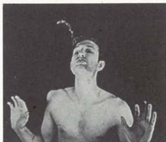
4. Autorretrato en forma de fuente ( Self-portrait as a Fountain ), 1966/1970

Pertenece a la serie once fotografías en color 49,8 x 59,7 cm