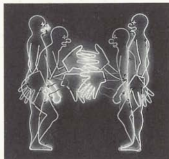
6. Bienvenida al payaso soez ( Mean Clown Welcome ), 1986

Colección Hirshhorn Museum and Sculpture Garden, Smithsonian Institution, Washington, D.C.