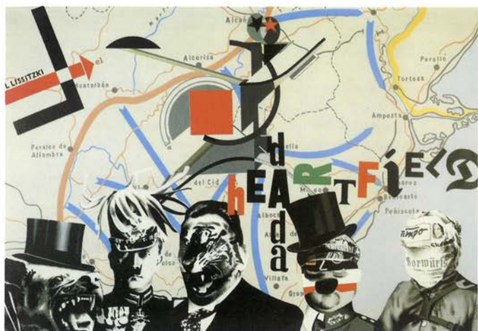
HEARTFIELD/LISSITZKY, DOS FRENTES , 1974

definidas. La exposición sólo contiene obra pictórica, excepto dos serigrafías iniciales y la última serie inacabada sobre papel, excluyendo la escultura, los dibujos y sobre todo la obra gráfica, ya que el año pasado, el Museo de Bellas Artes de Bilbao presentó una muestra completa de esta obra gráfica.