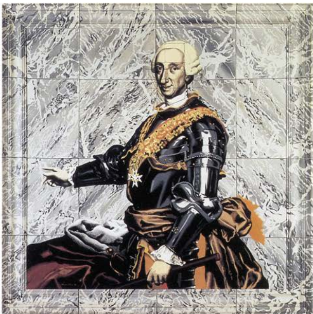
MARMOLES, SEDAS Y METALES, 1973

El criterio de estructuración de la muestra se ha confeccionado a partir del texto publicado por el Equipo Crónica en su última exposición a excepción de la serie titulada por su comisario, Tomás Llorens, «Lo público y lo privado» según las conversaciones personales que en su momento mantuvo con los miembros del colectivo. Se han enfatizado las series más coherentes y