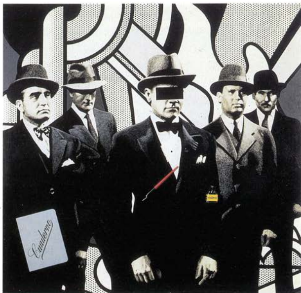
EL DÍA EN QUE APRENDÍ A ESCRIBIR CON TINTA, 1972

Surgidos como una de las propuestas más coherentes del movimiento figurativo que, a principios de los años 60, intentó dejar atrás la brillante pintura informalista española, en los planteamientos estéticos del Equipo Crónica (1965-1981) sigue destacando hoy la fuerza de algunas de sus soluciones al tiempo que pervive en muchas de sus obras una penetrante capacidad para evocar la atmósfera visual de una época. El paso de los años ha conferido a sus cuadros una naturaleza emblemática y su visión nos ayuda a organizar la memoria de unos acontecimientos y la experiencia personal de una generación.