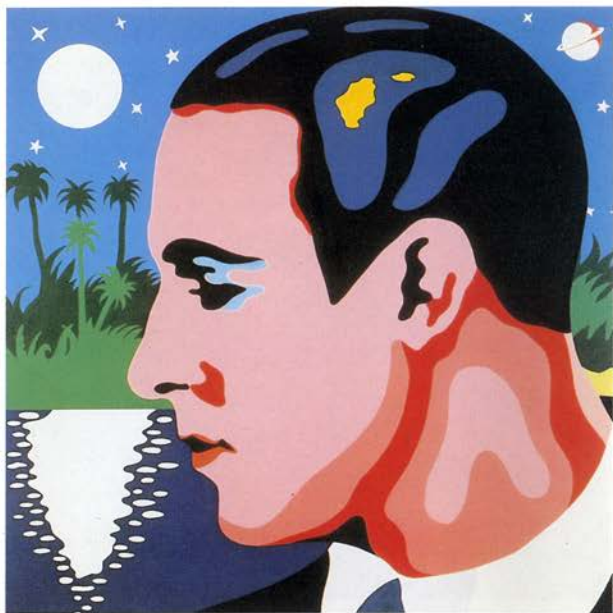
LATIN LOVER, 1966