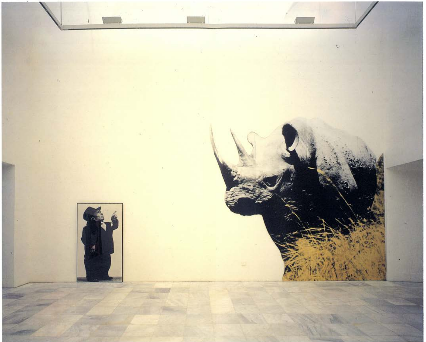
Dwarf and Rhinoceros (With Large Black Shape), Enano y rinoceronte (con gran forma negra). Detalle.

Con A New Sense of Order: The Art Teacher's Story , 1972-73 y Structure by Color Series: Simone with Fruit , 1975, queremos también introducir dos temas que son constantes en su obra: la catástrofe y el sexo. Como segunda parte hemos elegido un