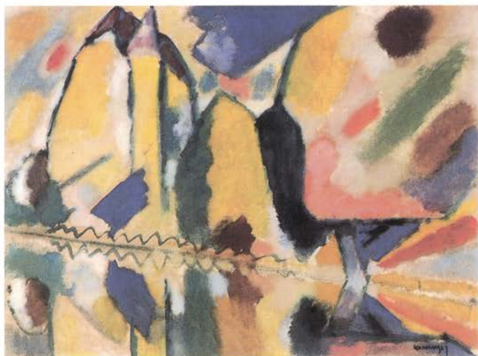
WASSILY KANDINSKY. «Otoño II», 1912

Para todo viajero que llegue a Washington y posea un mínimo interés por el arte, ningún recorrido podrá considerarse completo si no incluye una visita a la Colección Phillips .