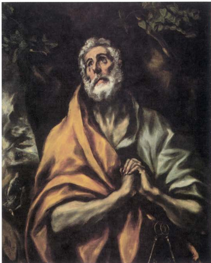
EL GRECO. «Las lágrimas de San Pedro», ca. 1600

cabida a las exposiciones temporales con las más modernas instalaciones.