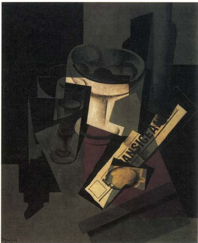
JUAN GRIS. «Bodegón con periódico», 1916