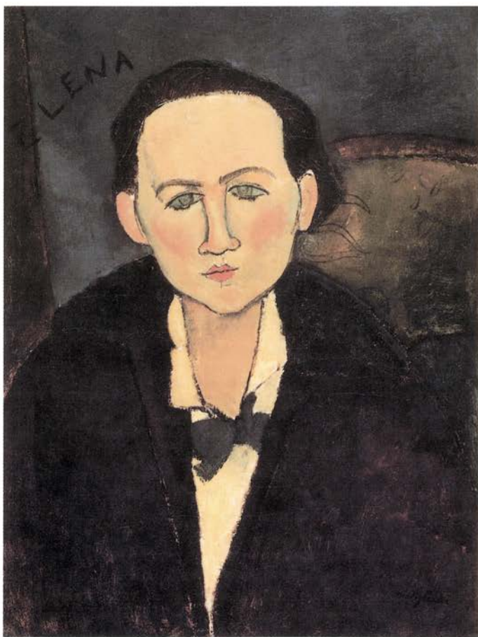
AMEDEO MODIGLIANI. «Elena Paulowski», 1917

En la década de los años 60, la colección contaba ya con más de dos mil obras y esto obligó a construir un anexo a la vieja mansión. Este anexo está siendo remodelado actualmente para poder dar