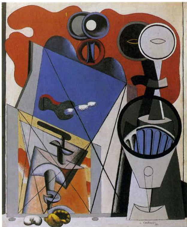
LA LINTERNA Y LAS JUDÍAS, 1930.

Defendía que cualquier cosa construida debía ser fruto de la combinación de las tres artes mayores y ciertamente nos dejó varias muestras palpables de ello: Ronchamp — su sueño —, el museo de Zurich — el poema . Poseía la estricta capacidad analítica del más severo arquitecto racionalista junto con la exuberante imaginación del expresionista.