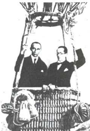
CON EL PINTOR OZENFANT.

Encuentro con Amédée Ozenfant. Exposición Ozenfant y Jeanneret en la Galerie Thomas. Publica con Ozenfant Après le Cubisme .