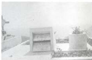
PANTEÓN FAMILIAR DE L. C. EN ROQUEBRUNE, CAP-MARTIN.

El 1 de septiembre, en el patio cuadrado del Louvre, André Malraux rinde un homenaje póstumo a Le Corbusier.