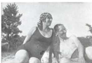
CON SU MUJER, YVONNE.

*Unidad de Habitación en Berlín-Charlottenburg. Cinco Unidades de Habitación en Meaux. Aéro-club de Doncourt. Exposición de tapices de Le Corbusier en el Museo de La Chaux-de-Fonds. Muerte de Yvonne Le Corbusier. Publicación de Von der Poesie des Bauens .