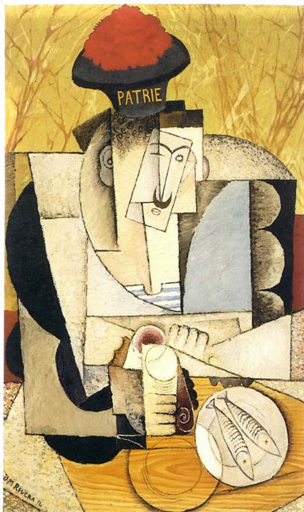
Marino almorzando , 1914, óleo sobre lienzo, 114×70 cm. Guanajuato. Museo Diego Rivera (INBA).

Giotto y la técnica cuatrocentista del fresco, a la vez que el arte público renacentista de Paolo Ucello, Lorenzetti, Rafael y Miguel Ángel.