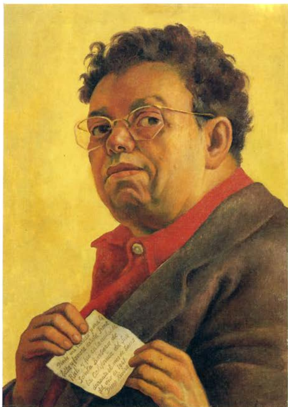
Autorretrato , 1941, óleo sobre lienzo, 61 × 43 cm. Northampton, Massachusetts, Smith College Museum of Art, donación de Irene Rich Clifford, 1977.

Diego Rivera, hombre que fue mito en su tiempo, es un artista a la vez polifacético y polémico. Aunque Rivera es reconocido internacionalmente, junto con Orozco y Siqueiros, como el artífice de la gran aportación mexicana a las artes plásticas del siglo XX, es decir, el muralismo, nuestra visión de su obra, sin embargo, no sería completa sin conocer su etapa formativa que tuvo lugar en Europa entre 1907 y 1921.