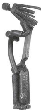
Pequeña Venus, c. 1936

Distanciándose de la imagen esquemática que ha llevado a entender a Julio González esencialmente como precursor de la escultura de las décadas intermedias del siglo XX, la colección del IVAM responde sobre todo a la necesidad de afrontar su obra en sus propios términos y en los de su contexto histórico, el de los años 30, un periodo en el que las vanguardias entran en crisis tras el abrumador dominio ejercido por el cubismo hasta mediados de los 20. La colección no solo intenta hacer justicia al lugar preeminente que la obra de González ocupa en el desarrollo de la escultura moderna, sino también reflejar al mismo tiempo su diversidad y singularidad, que hace que la habitual lectura formalista y unidireccional y lógica no sea la más certera y esclarecedora.