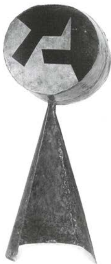
Los Enamorados II, c. 1932

Junio-Septiembre: trabaja en La Soudure Autogène Française, un taller en Boulogne-sur-Seine, donde aprende las técnicas de la soldadura oxicetilena.