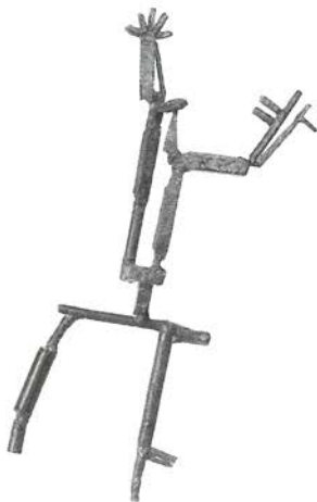
Bailarina con margarita, c. 1937

Hace las primeras máscaras en metal repujado.