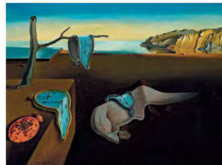
The Museum of Modern Art, Nueva York

En 1924 André Breton publica su Manifiesto surrealista , proclamando la fatiga de todo y defendiendo como salvación del arte el único camino no explorado: el subconsciente con todos sus absurdos, con sus juegos ilógicos, sus obscenidades. Al movimiento surrealista le interesa el arte como método para alumbrar misterios de la vida o de los mecanismos psíquicos del hombre.