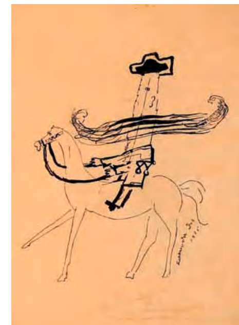
La república de los trabajadores , 1925 Colección Particular

La relación de Dalí con la Residencia y con sus principales inquilinos fue ambivalente, propiciando, finalmente, la ruptura con todo ello. La elaboración psíquica daliniana no se produjo, como es lógico, de la noche a la mañana. El clímax de dicha elaboración se dio fuera ya de la Residencia, en 1927, cuando el pintor recibió el poemario Canciones de Federico García Lorca. Al contestar a la carta del poeta, Dalí quiso afirmarse a sí mismo, estéticamente, “de otra clase de manera”. Así, los que antes eran “gente selecta” comenzaron a ser también putrefactos .