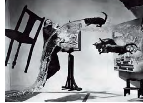
Fundació Gala-Salvador Dalí, Figueres

Muchos fueron los contactos y las personas que influyeron a Dalí durante su vida. El fotógrafo estadounidense Philippe Halsman y Dalí empezaron a colaborar juntos en la década de los años cuarenta, donde produjeron una serie de retratos con el pintor como protagonista, hasta el punto de lanzar un libro titulado "Dalí's Mustache" mostrando el bigote característico de Dalí en 36 diferentes vistas y posiciones. La idea de Dalí Atomicus surgió por la fascinación que ambos experimentaron al ver la fotografía de alta velocidad de Harold Edgerton, titulada "Coronet", donde se puede ver cómo una gota de leche al impactar con una superficie roja crea un patrón de corona.