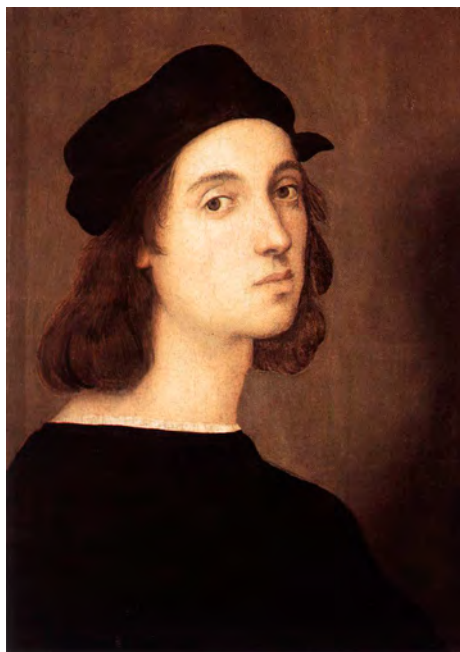
Rafael, Autorretrato , 1506 Galería degli Uffizi, Florencia

de hacer alarde de una particularidad morfológica. Es el propio Dalí, al aspirar a la «cumbre del arte», apropiándose de una parte de su cuerpo, quien crea un fenómeno delirante alrededor del cuadro. En este caso, nos encontramos muy cerca del proceso de interpretación paranoica que teorizará diez años más tarde. El cuello de Dalí está claramente deformado, en los límites de las proporciones humanas, en una anamorfosis que apunta a convertirlo en un órgano de simbología fálica.