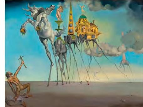
Musées royaux des beaux-arts de Belgique, Bruselas

Durante los últimos años sesenta, la cultura pop estaba empapando cualquier contexto cultural y habría sido difícil no dejarse influir por ella. En Nueva York, Dalí intimó con Andy Warhol, asistía a conciertos de David Bowie y le encantaba el maquillaje grotesco de Alice Cooper. Empezó a incluir en sus pinturas iconos y figuras mediáticas de este nuevo mundo de la sociedad de masas.