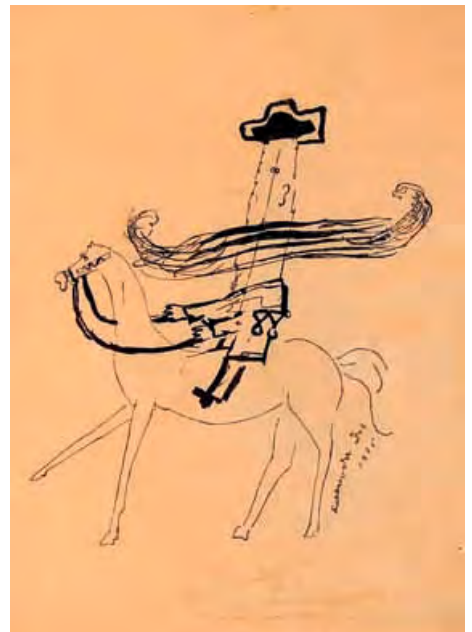
La república de los trabajadores, 1925

La relación de Dalí con la Residencia y con sus principales inquilinos fue ambivalente, propiciando, finalmente, la ruptura con todo ello. La elaboración psíquica daliniana no se produjo, como es lógico, de la noche a la mañana. El clímax de dicha elaboración se dio fuera ya de la Residencia, en 1927, cuando el pintor recibió el poemario Canciones de Federico García Lorca. Al contestar a la carta del poeta, Dalí quiso afirmarse a sí mismo, estéticamente, “de otra clase de manera”. Así, los que antes eran “gente selecta” comenzaron a ser también putrefactos .