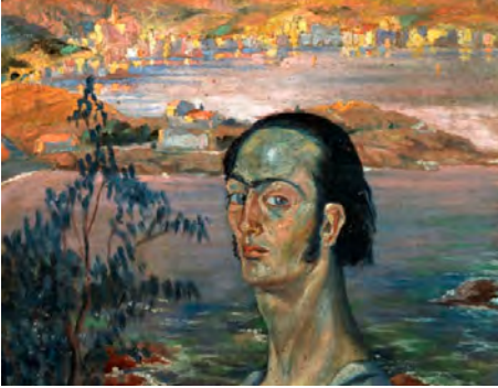
Fundació Gala-Salvador Dalí, Figueres