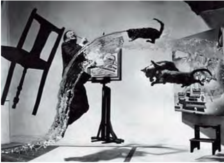
Fundació Gala-Salvador Dalí, Figueres

Muchos fueron los contactos y las personas que influyeron a Dalí durante su vida. El fotógrafo estadounidense Philippe Halsman y Dalí empezaron a colaborar juntos en la década de los años cuarenta, donde produjeron una serie de retratos con el pintor como protagonista, hasta el punto de lanzar un libro titulado “Dalí’s Mustache” mostrando el bigote característico de Dalí en 36 diferentes vistas y posiciones. La idea de Dalí Atomicus surgió por la fascinación que ambos experimentaron al ver la fotografía de alta velocidad de Harold Edgerton, titulada “Coronet”, donde se puede ver cómo una gota de leche al impactar con una superficie roja crea un patrón de corona.