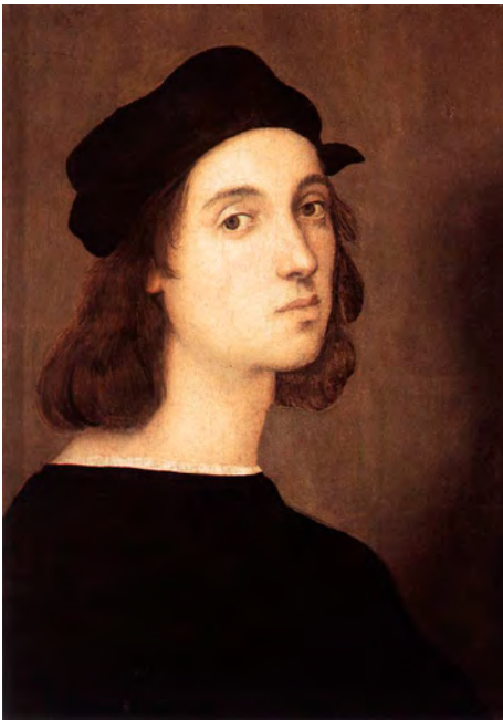
Rafael, Autorretrato , 1506 Galería degli Uffizi, Florencia

de hacer alarde de una particularidad morfológica. Es el propio Dalí, al aspirar a la «cumbre del arte», apropiándose de una parte de su cuerpo, quien crea un fenómeno delirante alrededor del cuadro. En este caso, nos encontramos muy cerca del proceso de interpretación paranoica que teorizará diez años más tarde. El cuello de Dalí está claramente deformado, en los límites de las proporciones humanas, en una anamorfosis que apunta a convertirlo en un órgano de simbología fálica.