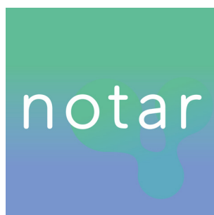
Programa de residencias de investigación

MAR está conformada por tres nodos que componen un espacio de encuentro en el que compartir experiencias y aprendizajes, y desde el cual tejer nuevos conocimientos y abordajes críticos para desdibujar las fronteras tradicionales entre las organizaciones culturales y la sociedad civil; entendiendo que la mediación cultural puede propiciar un cambio de paradigma que implique efectivamente a todas las personas en la vida cultural y en la esfera pública.