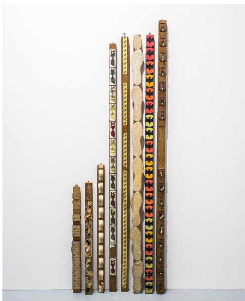
ROBERT FILLIOU 8 Measurement Poems [8 poemas medida], 1966 8 Varas de madera de diferentes largos con varios objetos Museum van Hedendaagse Kunst vzw © Estate of Robert Filliou

En la segunda sección , se muestran las exposiciones y eventos de la Something Else Gallery , la galería vinculada a la editorial, activa entre 1966 y 1972, asentada en el salón de la vivienda familiar de Higgins y Knowles, en el barrio de Chelsea, Nueva York.