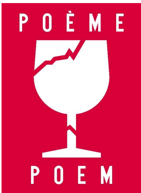
ROGELIO LÓPEZ CUENCA Poem , 1989 Óleo sobre lienzo 162 x 130 cm Centro Andaluz de Arte Contemporáneo

Pinturas, fotografías, vídeos, instalaciones, fotografías de gran formato intervenidas con óleo e incluso la reproducción de una tienda de souvenirs, datadas desde finales de los 80 hasta la actualidad, estarán presentes en esta retrospectiva que incluye, además, un conjunto de piezas creadas especialmente para la exposición, Las Islas , en las que López Cuenca transita entre diferentes técnicas, soportes y discursos: videoensayo-instalación-arte textil realizando una relectura crítica de algunos textos y grabados históricos relacionados con el “descubrimiento” de América.