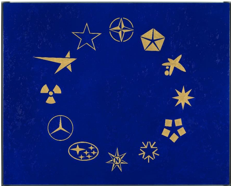
ROGELIO LÓPEZ CUENCA Bandera de Europa , 1992 Óleo sobre lienzo 130 x 162 cm Colección "la Caixa". Arte Contemporáneo

otros producidos por el artista de manera que resulte complicado distinguir cuáles son los reales y cuáles no ya que, en palabras del artista, “en ocasiones son más increíbles los reales que los que se hacen con un afán de parodiarlos”.