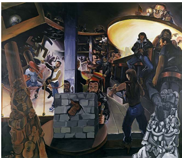
Jörg Immendorff. Café Deutschland I , 1978 Acrílico sobre lienzo, 265 x 333 cm Museum Ludwig, Colonia. Depósito de Peter und Irene Ludwig Stiftung 1986

En los primeros años 80, Immendorff se preocupó específicamente por la división de Alemania. En la siguiente sala, el cuadro Naht ( Sutura , 1981) encarna emblemáticamente la cicatriz que recorría la frontera que separaba ambos estados alemanes durante la Guerra Fría. Sin embargo, ya más entrada la década, sorprende que el proceso de reunificación culminado con la apertura del Muro de Berlín en 1989 no encontrara ninguna expresión concreta en sus obras de la época.