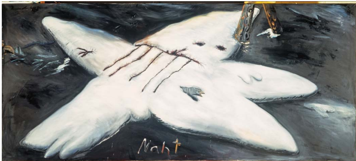
JÖRG IMMENDORFF Naht (Sutura) , 1981 Óleo sobre lienzo 180 × 400 cm Museum Kunstpalast, Düsseldorf