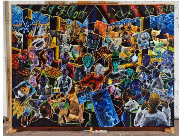
Jörg Immendorff. Café de Flore , 1990-91 Óleo sobre lienzo 300 x 400 cm Birkelsche Stiftung für Kunst und Kultur

Con el grupo de obras Café de Flore (1987-1992), Immendorff había finalmente hecho realidad su inconfundible autodeterminación artística, que se distingue por una marcada fuerza expresiva y por la multiplicidad de capas narrativas. El parisino Café de Flore era conocido en los años 60 por ser el punto de reunión de Jean-Paul Sartre y Simone de Beauvoir. En las piezas de Immendorff aparecen representados otros colegas artistas, comisarios de exposiciones, escritores, galeristas y coleccionistas, y en el centro de dichas piezas, el artista desempeña varios roles. Las configuraciones de los cuadros que integran este conjunto recaen en las grandes figuras de las vanguardias del siglo XX, en particular en Marcel Duchamp, así como en los expresionistas y surrealistas.