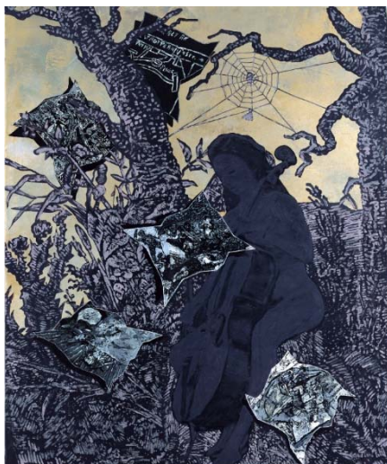
JÖRG IMMENDORFF Ohne Titel (Sin título), 2007 Óleo sobre lienzo 240 x 200 cm Galerie Michael Werner, Märkisch Wilmersdorf, Köln und New York

También se pueden ver algunas de sus últimas obras, muchas de ellas sin título, en las que por su enfermedad Immendorff se vio obligado a adaptar su trabajo a su discapacidad física. Con una asombrosa energía, creó métodos para generar imágenes que le permitían delegar cada vez más la ejecución de sus ideas visuales.