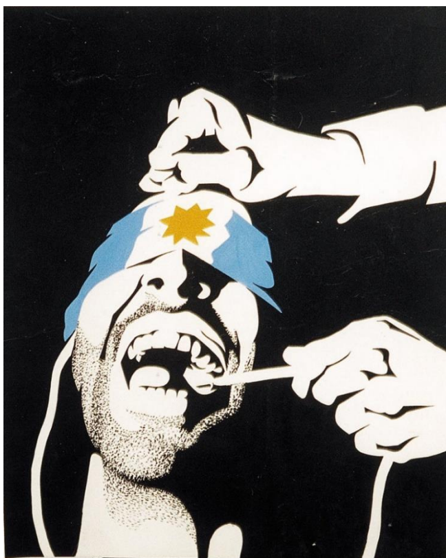
JULIO LE PARC La tortura en Argentina , 1972. Archivo Graciela Carnevale

FECHAS: 18 de mayo de 2022 - 10 de octubre de 2022