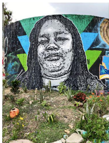
DjLu. Serie "Nos están matando", 2012. Colección particular del artista

Del caso concreto de Chile se muestran unos pliegos impresos de Primer Homenaje a Santiago Nattino de la Agrupación de Plásticos Jóvenes (APJ) , que realizó una acción a partir múltiples copias de papel intervenidas con pintura con el rostro de Nattino -un artista comunista asesinado en 1986 bajo el régimen de Pinochet- con las que cubrieron los edificios de diversas instituciones culturales sujetas a la censura dictatorial.