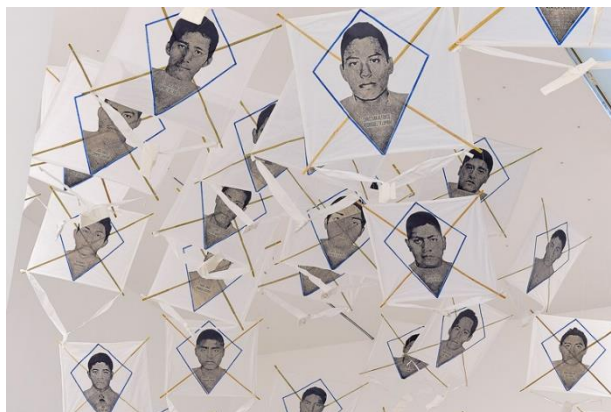
FRANCISCO TOLEDO Papalotes de los desaparecidos , 2014. Centro de Documentación Arkheia, MUAC, UNAM-DiGAV

El suceso, aún sin esclarecer, generó numerosas reacciones por parte de la sociedad civil, dentro y fuera del país. Una de ellas fue Papalotes de los desaparecidos (2014), una obra del artista zapoteca Francisco Toledo (México, 1940-2019) que consiste en 43 cometas o papalotes de papel donde aparecen los rostros de los desaparecidos y que él mismo voló por las calles de la ciudad de Oaxaca en compañía de algunos niños. Esta iniciativa responde a una tradición de México durante el Día de Muertos, cuando se vuelan papalotes para que las almas pueden bajar a recoger sus ofrendas desde el cielo.