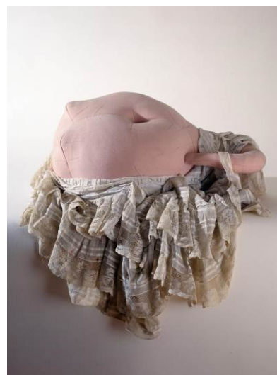
DOROTHEA TANNING Emma , 1970 Tela, lana y encaje 61 x 81,3 x 55,9 cm The Nelson-Atkins Museum of Art, Kansas City. Adquisición: comprado con la generosidad de la William T. Kemper Foundation-Commerce Bank, Trustees)

Presagiando las esculturas blandas de Louise Bourgeois y apostando por lo artesanal más que por el objeto industrial, Tanning adelantó el objeto surrealista para que adquiriera nuevas cualidades al sentido del tacto y cierta condición fetichista. El énfasis en la blandura también desafió entonces la moda del minimalismo de vanguardia en el mundo del arte y el anonimato del floreciente consumismo de masas en la sociedad occidental.