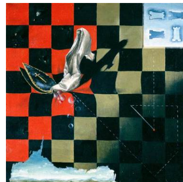
DOROTHEA TANNING Endgame , 1944 (Fin del juego) Óleo sobre lienzo 43 x 43 cm Colección Harold y Gertrud Parker

En 1944 Julien Levy organizó una exposición The Imagery of Chess (Imágenes del ajedrez) en su galería de Nueva York en la que se exhibió la pintura de Tanning Endgame – Fin del juego -(1944). En esta obra, la Reina (con un zapato de satén blanco) aparece en el centro del escenario destruyendo al alfil (un obispo simbolizado por la mitra) y, por extensión, a la Iglesia y a los códigos morales que representa en la sociedad.