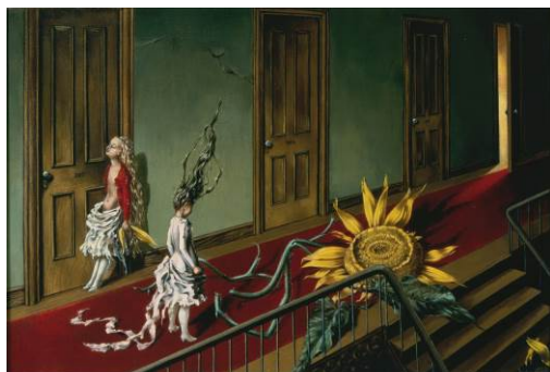
DOROTHEA TANNING Eine Kleine Nachtmusik , 1943 Óleo sobre lienzo 40 x 61 cm Taller. Adquisición con la ayuda del Art Fund y el American Fund for the Yale Gallery, 1997

La niña preadolescente de Tanning, a punto de alcanzar la conciencia de la sexualidad, aportó una nueva dimensión al surrealismo en un momento en que André Breton aconsejaba que la sociedad desgarrada por la guerra necesitaba buscar inspiración en lo femenino. Es el potencial erótico de la chica lo que causa estragos en los interiores domésticos y las expectativas de la burguesía.