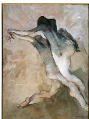
DOROTHEA TANNING Tango Lives , 1977 ( El tango vive ) Óleo sobre lienzo 130 x 97 cm Moderna Mussel, Estocolmo