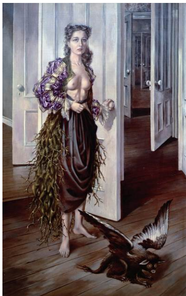
DOROTHEA TANNING Birthday , 1942 (Cumpleaños) Óleo sobre lienzo 102,2 x 64,8 cm Philadelphia Museum of Art Adquisición en el 125 Aniversario. Compra con fondos de contribución