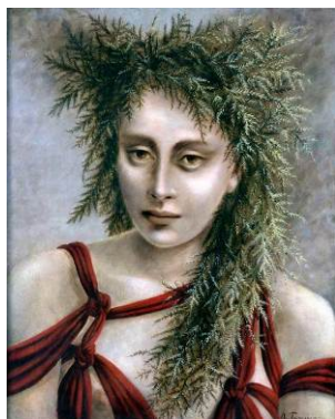
DOROTHEA TANNING Deirdre , 1940 Óleo sobre lienzo 53,5 x 43,3 cm Colección particular

La exposición comienza con las primeras obras de Dorothea Tanning, quien creció en la pequeña ciudad de Galesburg, Illinois, y luego viajó en los años 30 a Chicago y Nueva York para desarrollar su carrera como artista. Tanning descubrió la "ilimitada extensión de posibilidad" del surrealismo al ver la exposición Fantastic Art Dada Surrealism de Alfred Barr en 1936 en el MoMA de Nueva York.