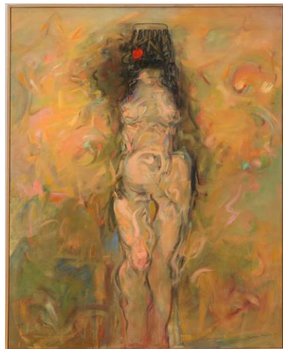
DOROTHEA TANNING Woman Artist, Nude, Standing , 1985-1987 (Mujer artista, desnuda, de pie) Óleo sobre lienzo 162 x 130 cm The Destina Foundation. Nueva York