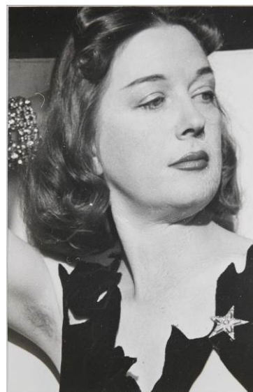
MAN RAY Dorothea Tanning, ca. 1946 Fotografía, copia nueva (2018) 13,6 x 9 cm The Skylark Foundation

Dorothea Tanning. Detrás de la puerta, invisible, otra puerta recupera la visión única y audaz de la artista estadounidense. Ella misma habló en estos términos de su práctica artística: "Tú sacas el cuadro de su jaula junto con la persona [...] Tú eres simplemente el visitante, magníficamente invitado: Entra". Esta exposición invita al espectador a adentrarse también en su mundo de revelaciones ocultas.