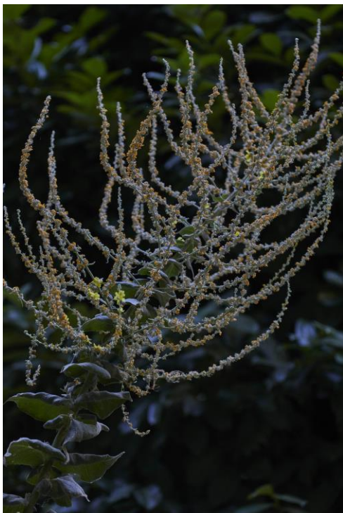
ALEJANDRA RIERA La reina se inclina hacia el sol. Jardín de las mixturas. Vista parcial a 8 de julio de 2019.

En la planta baja, también del edificio Sabatini, ese mismo gesto de “apertura” se traslada al jardín del antiguo hospital donde, desde 2017, el colectivo Jardín de las mixturas , abierto e integrado por personas de dentro y fuera del Museo, ensaya formas de convivencia interrogándose acerca de “las presencias humanas-y-no humanas ”.