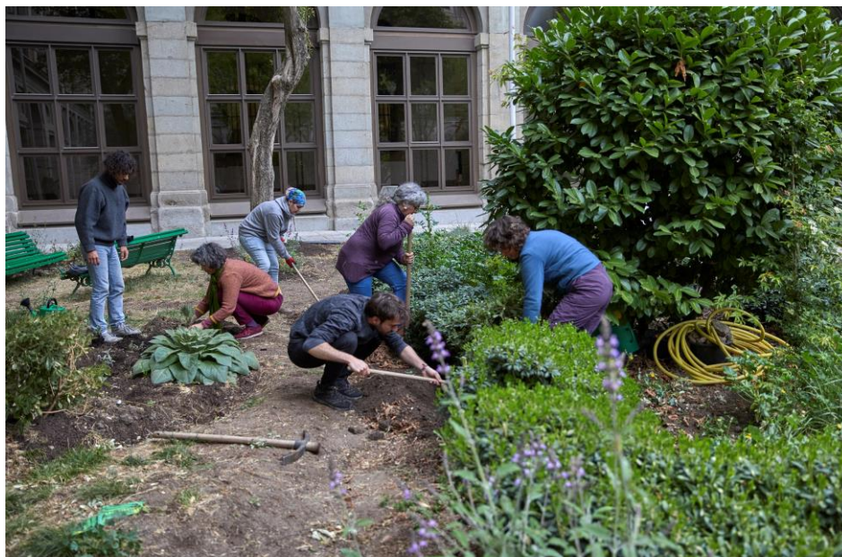
Exposición Alejandra Riera <Jardín de las mixturas. Tentativas de hacer lugar, 1995 - ...> Museo Nacional Centro de Arte Reina Sofía. Mayo, 2022