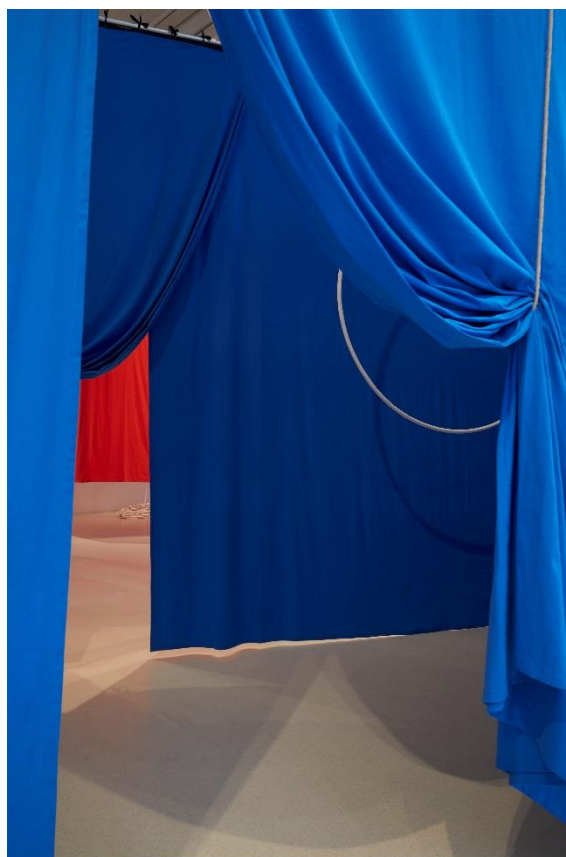
Vista de la exposición Ulla von Brandenburg. Espacios de una secuencia en el Palacio de Velázquez. Noviembre, 2023 Museo Nacional Centro de Arte Reina Sofía Archivo fotográfico del Museo Reina Sofía

La producción fílmica que Ulla von Brandenburg viene desarrollando de forma intensa y continuada desde 2002 se materializa en videoinstalaciones que son resignificadas según los distintos contextos en los que se exponen.