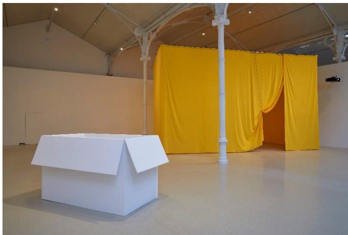
Vista de la exposición Ulla von Brandenburg. Espacios de una secuencia en el Palacio de Velázquez. Noviembre, 2023 Museo Nacional Centro de Arte Reina Sofía

Von Brandenburg actualiza los postulados de Goethe a través de la Escuela de la Bauhaus y, más concretamente, de los conceptos propuestos por el artista Oskar Schlemmer, quien planteó ideas para un ballet basadas en tres formas geométricas: círculo, cuadrado y triángulo. Para él, los colores debían de cambiar de forma paralela a los estados de ánimo, lo que se plasmaría en su obra Das Triadische Ballett (El Ballet Triádico), cuya primera representación fue en 1922.