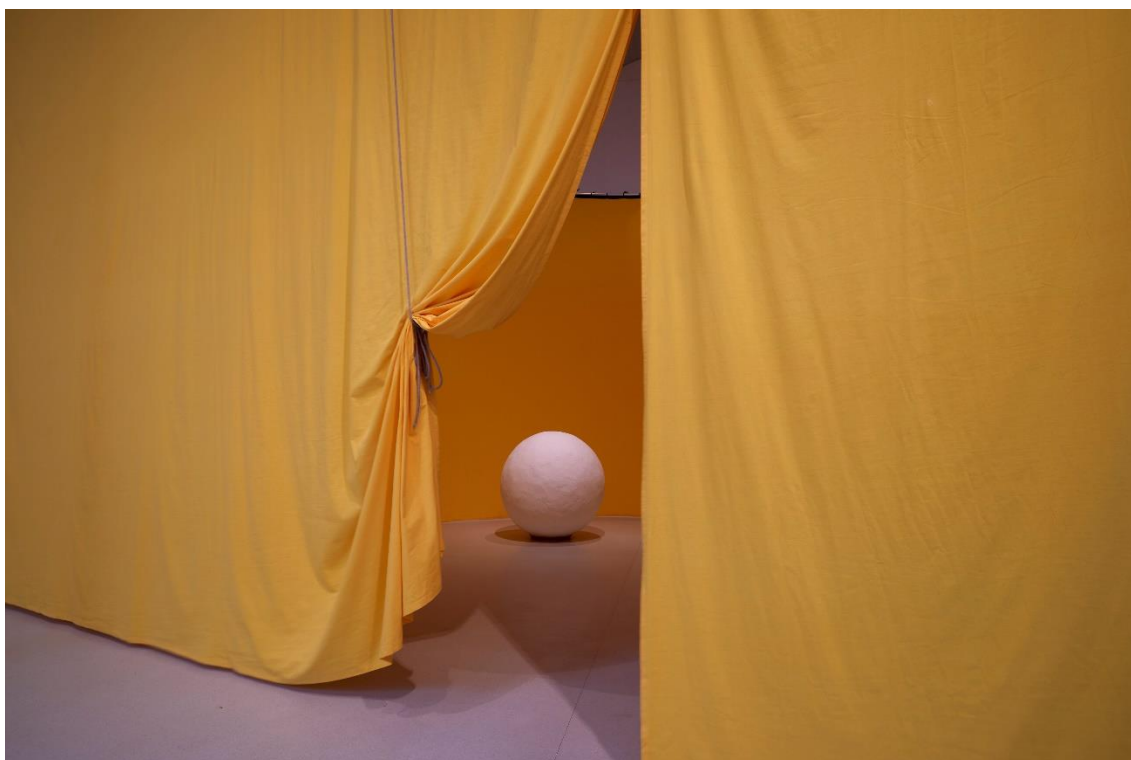
Vista de la exposición Ulla von Brandenburg. Espacios de una secuencia en el Palacio de Velázquez. Noviembre, 2023 Museo Nacional Centro de Arte Reina Sofía