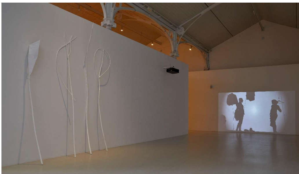
Vista de la exposición Ulla von Brandenburg. Espacios de una secuencia en el Palacio de Velázquez. Noviembre, 2023 Museo Nacional Centro de Arte Reina Sofía

Sus películas exploran el lenguaje teatral, con una especial atención a los componentes performativos y psicológicos de los personajes que las protagonizan. La mayor parte de ellas están rodadas en 16 mm, siendo el formato un condicionante de la duración del contenido, que a menudo se presenta en un único plano secuencia, sin apenas montaje y posproducción. Así pues, la artista muestra como la acción humana está tan implicada en la obra como la bambalina y lo imponderable.