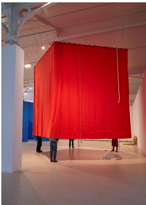
Vista de la exposición Ulla von Brandenburg. Espacios de una secuencia en el Palacio de Velázquez. Noviembre, 2023 Museo Nacional Centro de Arte Reina Sofía Archivo fotográfico del Museo Reina Sofía

Espacios de una secuencia , exposición creada específicamente para el Palacio de Velázquez, es una propuesta de la artista Ulla von Brandenburg (Karlsruhe, Alemania, 1971) en la que el espacio se transforma y se concibe como un escenario teatral en el que el público es el protagonista. A través de un recorrido por formas construidas con telones, en el que también hay obras audiovisuales y diversos objetos, la artista sumerge al visitante en una escenografía de la que le hace partícipe.