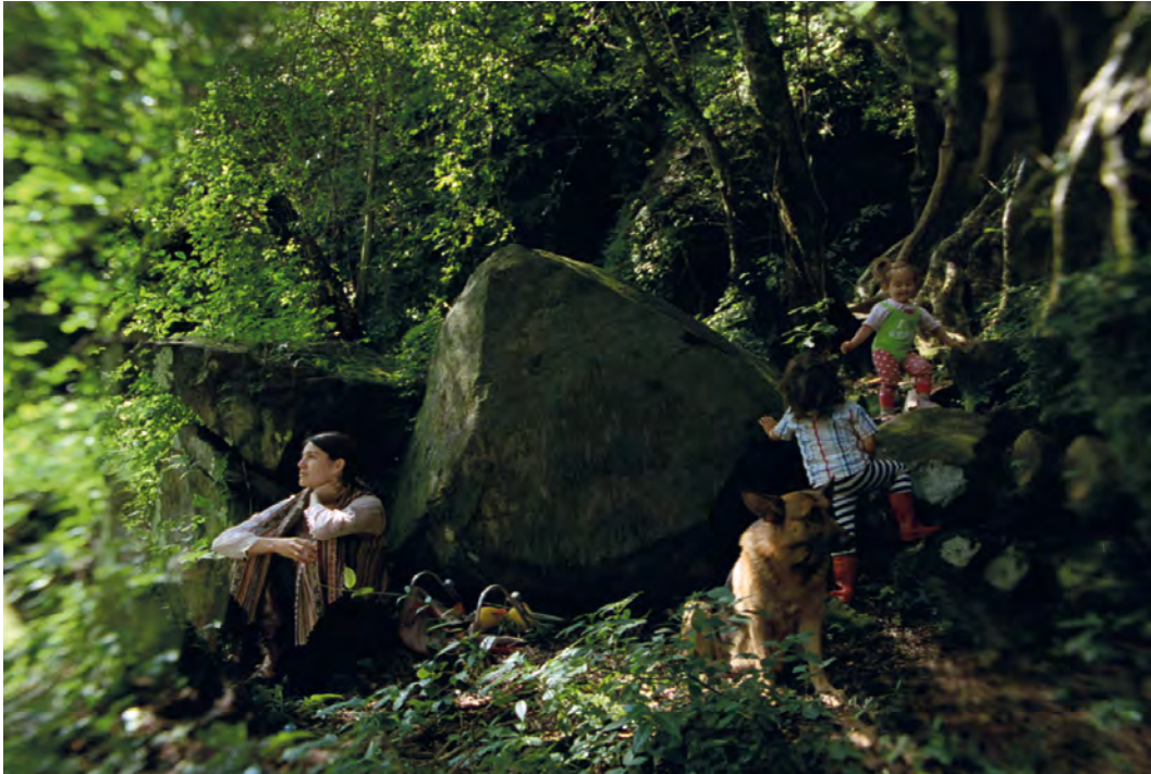
Carlos Reygadas. Post Tenebras Lux . Película, 2012

sus compañeros de escuela. Los desplantes extremos de violencia contrastan con el silencio y estoicismo de la chica, quien no osa alterar el precario estado mental de su padre, inmerso en un estupor depresivo, con sus propios problemas. La no resistencia de la chica y la parálisis del padre son el motor de este singular thriller , uno de los retratos más estremecedores de la crueldad del cine actual.