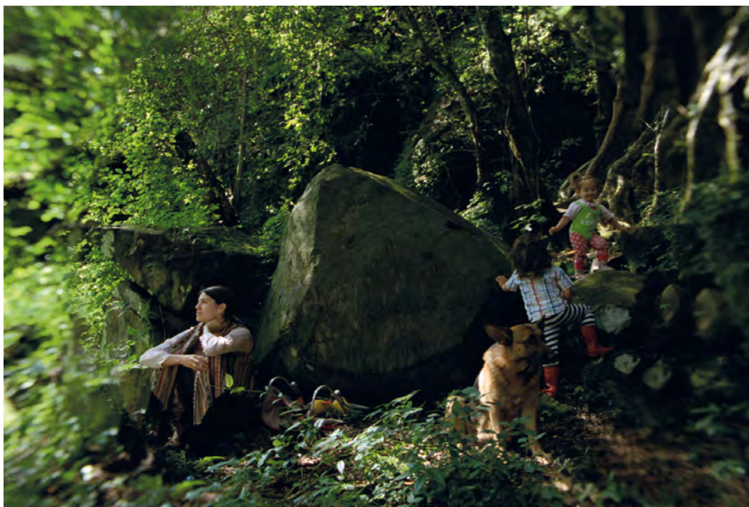
Carlos Reygadas. Post Tenebras Lux . Película, 2012

sus compañeros de escuela. Los desplantes extremos de violencia contrastan con el silencio y estoicismo de la chica, quien no osa alterar el precario estado mental de su padre, inmerso en un estupor depresivo, con sus propios problemas. La no resistencia de la chica y la parálisis del padre son el motor de este singular thriller , uno de los retratos más estremecedores de la crueldad del cine actual.