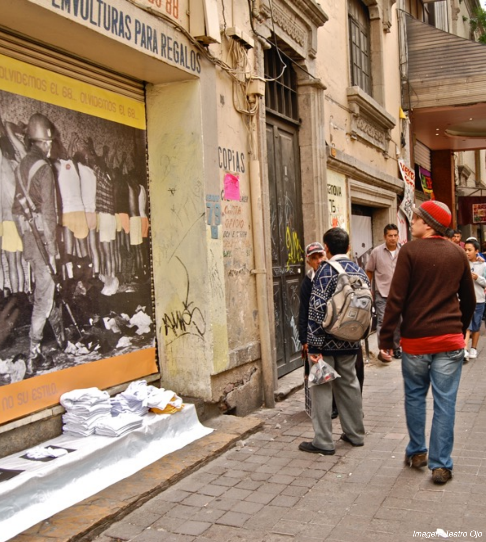
Imagen Teatro Ojo